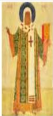
[А] Средник иконы