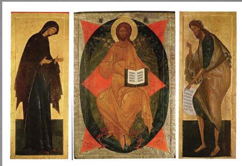
Деисусный чин Успенского собора Кирилло-Белозерского монастыря. 1497 Богоматерь, Иисус Вседержитель, Иоанн Предтече

В помощь себе Дионисий взял трех художников, а сам занялся деисусным чином — наиболее ответственной частью работы. Уже здесь он проявил себя как “мастер преизящный”, олицетворяющий черты московского иконописного стиля — изящную удлиненность пропорций, праздничность и светлость красок, красоту ликов.