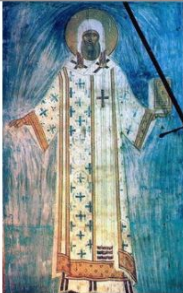
Митрополит Петр. Ферапонтов монастырь