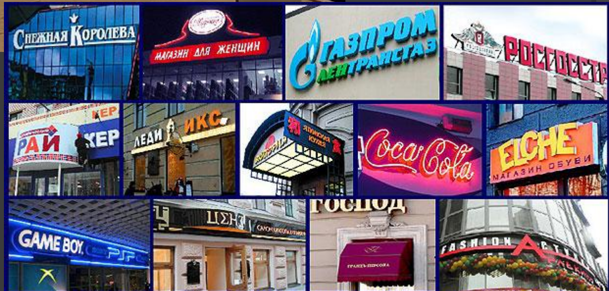
Вывески неоновые, короба световые, крышные установки, объемные буквы, маркизы, консоли.