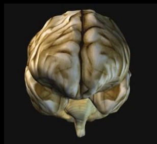
Нервная система (мозг)