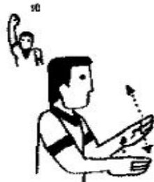
10. Неправильное ведение Движение выпрямленными кистями вверх-вниз на уровне пояса