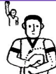
9. Нарушение при перемещении Вращение кистями, сжатыми в кулаки, на уровне груди