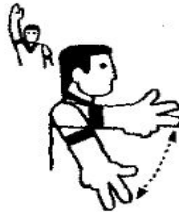
11. Нарушение 3 секунд Движение рукой по дуге вперед-вверх