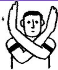
7. Замена игрока Скрестить руки перед грудью (кисти выше уровня плеч)