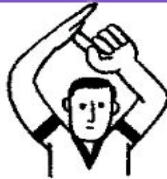
8. Перерыв в игре Ладонь и указательный палец образуют букву Т