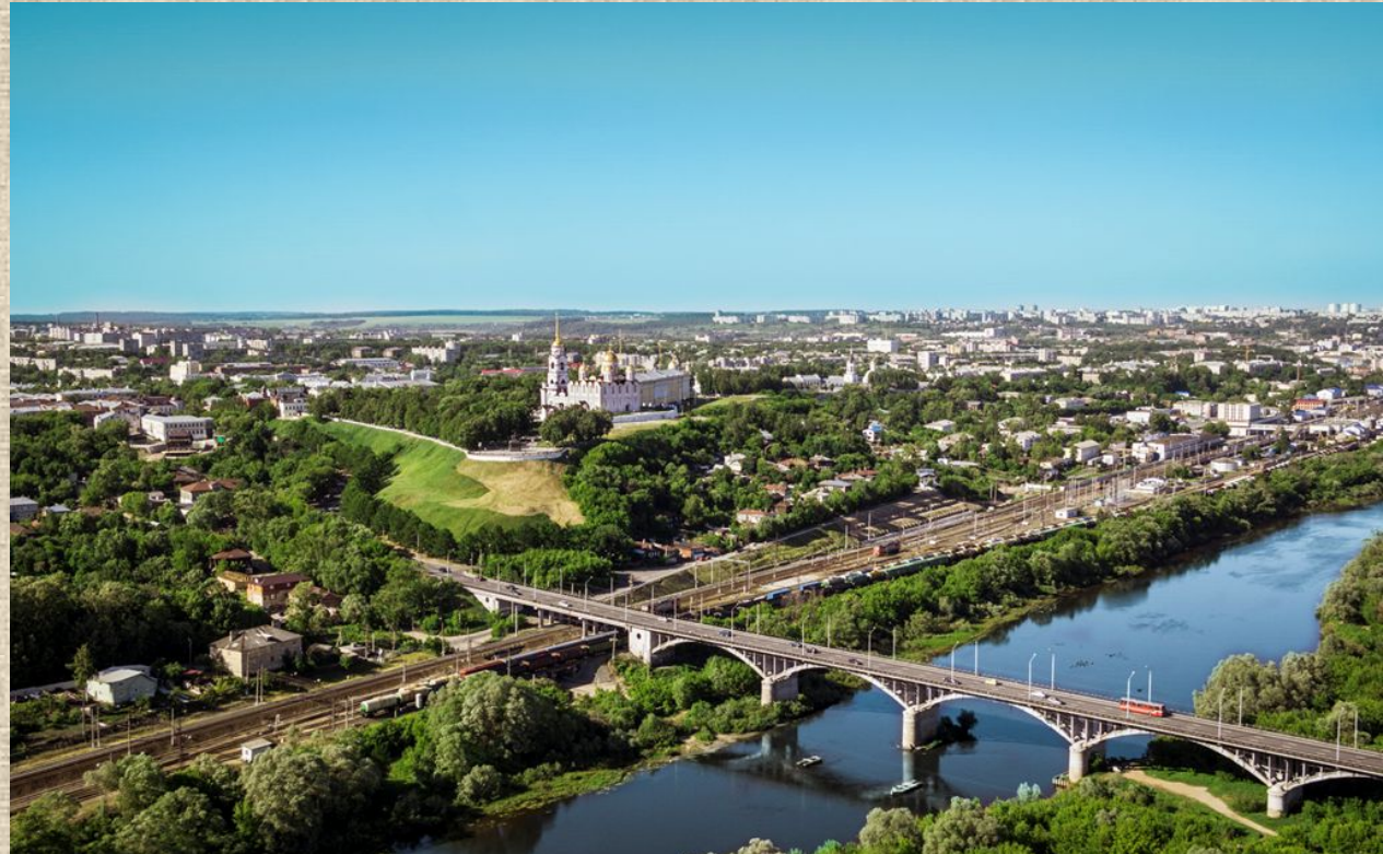
Город расположен на левом берегу реки Клязьмы.