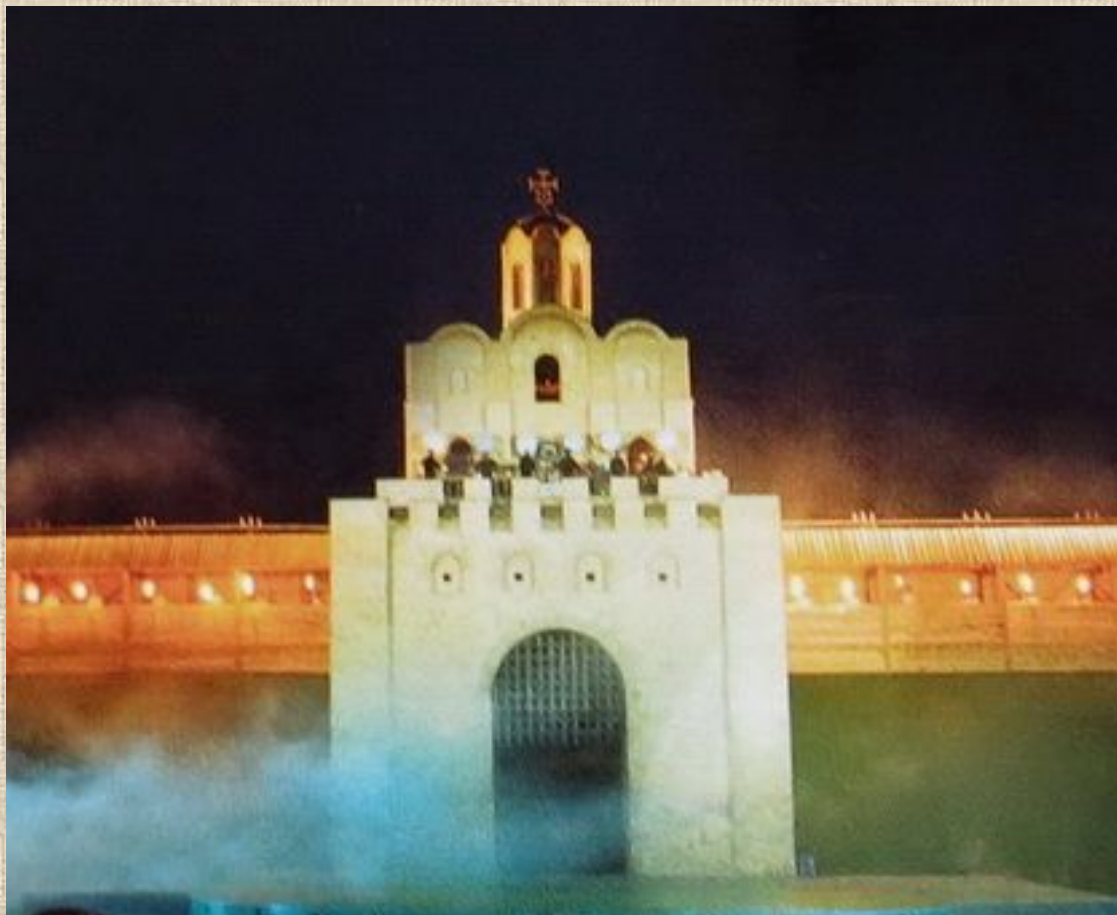
Макет Золотых ворот. Реконструкция