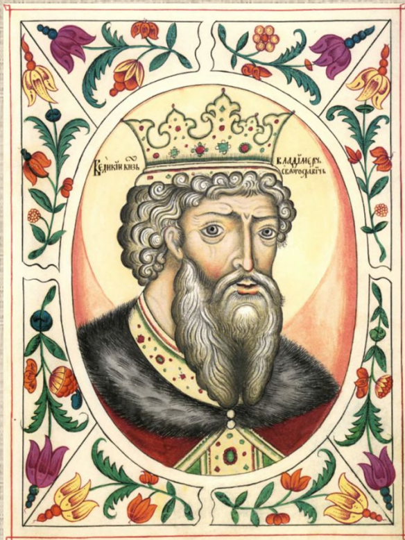
Князь Владимир Красное Солнышко (около 960 — 1015 года)

Считается, что город Владимир был основан князем Владимиром Святославовичем, при котором произошло Крещение Руси, около 990 года.