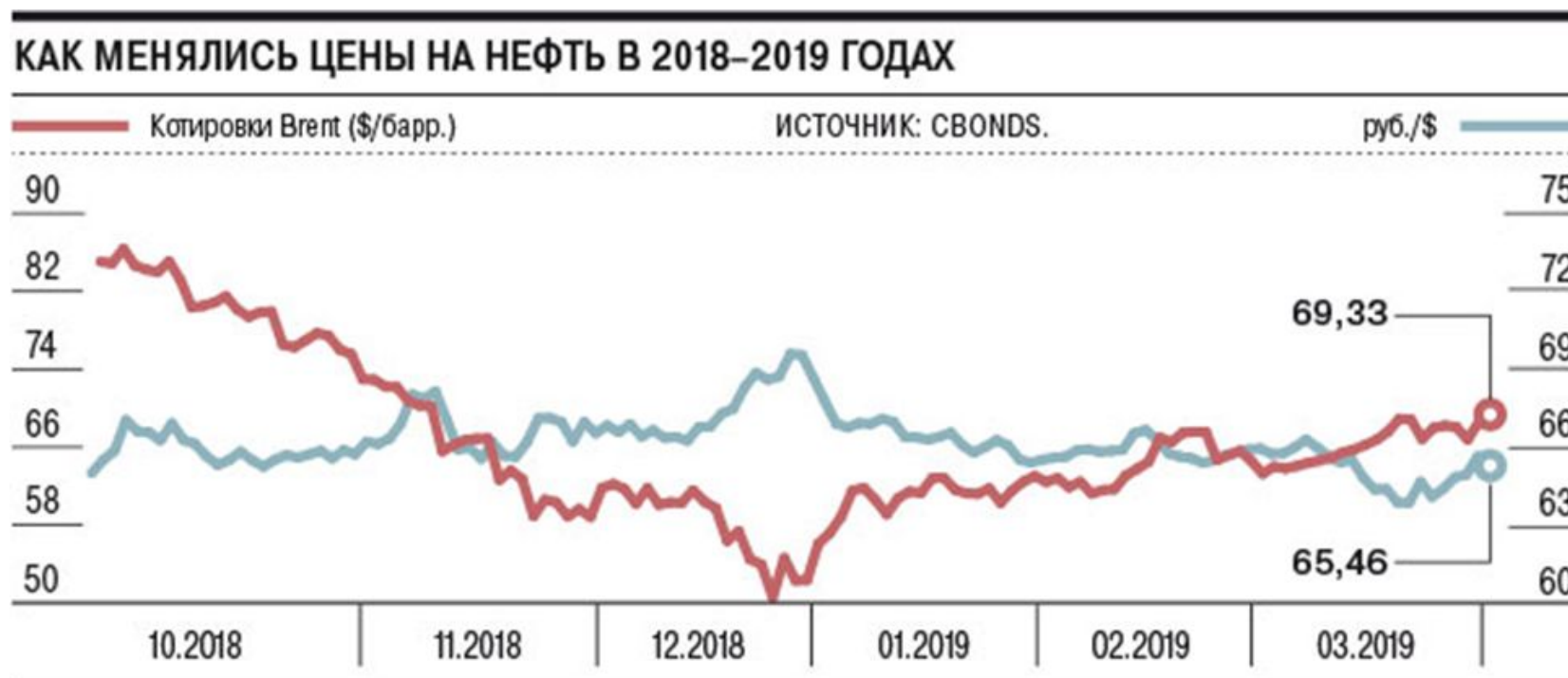
Рисунок 3 - Динамика цены на нефть и курса доллара к рублю в 2018 - 2019 гг.

Цена соотношения на нефть. Между такими показателями, как цена на нефть и курс доллара к рублю наблюдается достаточно высокая связь (по сравнению с остальными показателями) и обратная зависимость (-0,77), а между ценой на нефть и курсом рубля, наоборот, прямая зависимость. При росте цены на нефть, рубль крепнет. Данный тезис подтверждает рисунок 3.