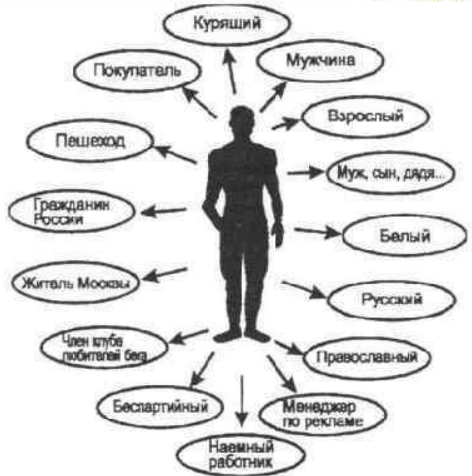
Статусный набор (портрет) человека

Статусный набор – совокупность всех статусов данного индивида.