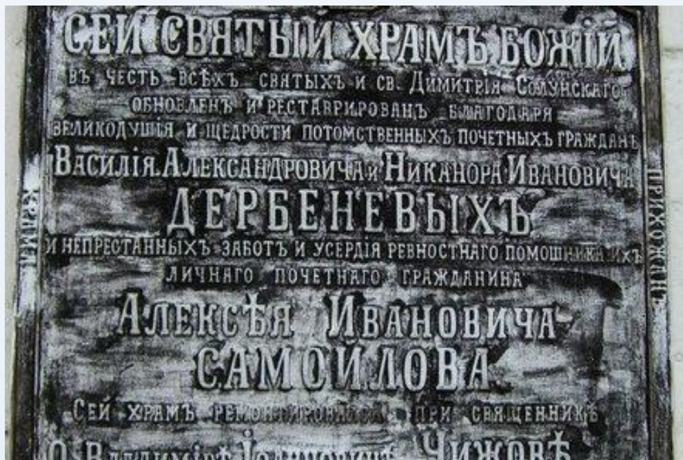
памятная доска на западной стене церкви Всех Святых с. Эдемское