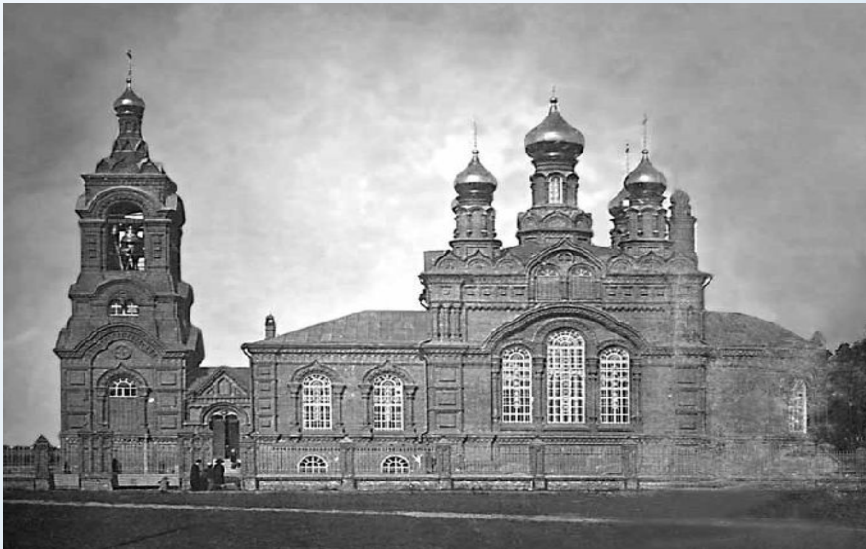
СВЯТО-ВОЗНЕСЕНКИЙ ХРАМ, 1906 ГОД