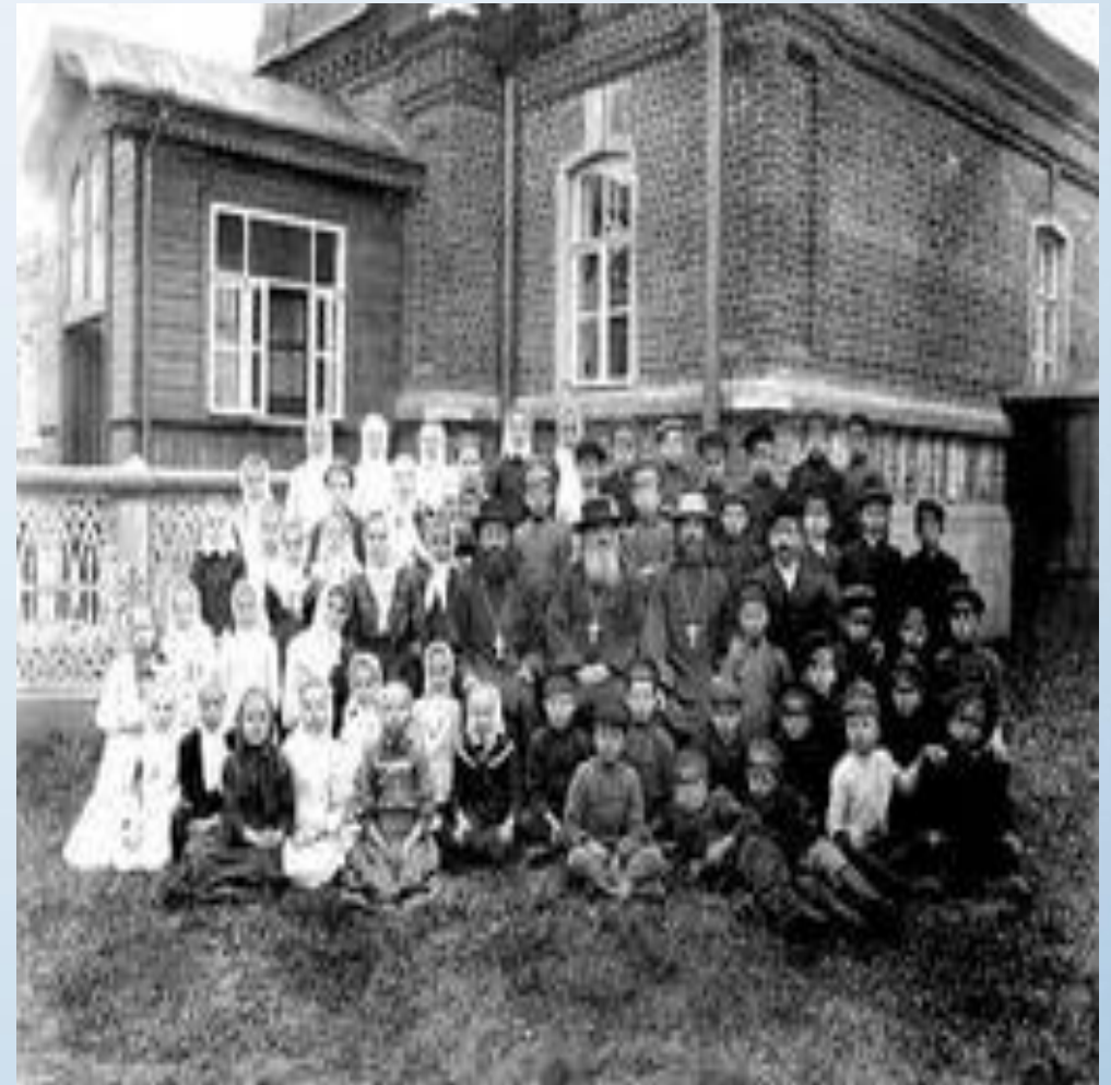
АВДОТЬИНЦЫ НА ЭКСКУРСИИ В ГОРОДЕ СУЗДАЛЬ

В дореволюционные годы единого названия населённого пункта не утвердилось – называли и «Камешки», и «Авдотьино». По поводу неприятия последнего в советское время высказывалось предположение, что здесь, очевидно, отразились социальные противоречия между рабочими фабрики и Дербенёвыми. В итоге появились насмешливые искажения: «Дунькин посёлок», «Каморки» (так рабочие называли служебные квартиры, выстроенные для них хозяевами фабрики).