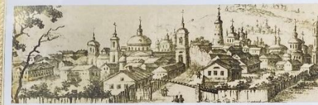
Переславль-Заlessкий (из альбомов Переславль-Заlessкого государственного историко-архивного и художественного музеев-заповедника). Фрагмент

Князь Александр Ярославич родился в городе Переславле-Заlessком 1 около 13 мая 1221 года в семье князя Ярослава Всеволодовича, сына князя Всеволода Большое Гнездо, и Ростиславы (Феодосии) Мстиславны, дочери князя новгородского и галицкого Мстислава Удалого (Удалого).