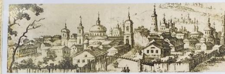
Переславль-Заlessкий (из альбомов Переславль-Заlessкого государственного историко-архивного и художественного музеев-заповедника). Фрагмент

Князь Александр Ярославич родился в городе Переславле-Заlessком 1 около 13 мая 1221 года в семье князя Ярослава Всеволодовича, сына князя Всеволода Большое Гнездо, и Ростиславы (Феодосии) Мстиславны, дочери князя новгородского и галицкого Мстислава Удалого (Удалого).