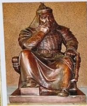
Batu Khan Хан Батый (1209–1255/56)

XIII век был временем междоусобицы на Руси. «Раепри князья несли разорение христианству и городам. ... Усобицы ослабляли военную мощь Руси и затрунили борьбу народа за независимость».