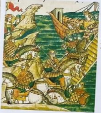
Гаврила Олексич выскакивает на вражеский корабль – шкису