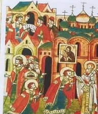
Молитва Александра Невского в храме Св. Софии и благословение его архиепископом герцога Битвы