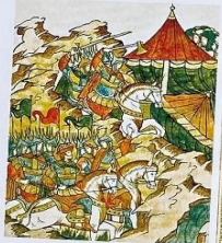
Киевский отрок Савва поссекает «златоверхий шатёр» Биргера

Ратгром шведов на Неве 15 июля 1240 года стал первой блистательной победой князя Александра Ярославича. Летописцы говорят о храбрости ратников Гаврилы Олексича, Сбыслава Язуневича, новгородца Миши, княжеского ловчего Якова Полочанина, Ратмира, умершего от ран, убитого отрока 1 Александрова. Савва подсекает «златоверхий шатёр» Биргера; «шатёр и россияне возгласили победу».