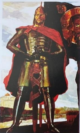
Худож. П.Д. Корин. Центральная часть триптиха «Александр Невский». 1942

Князь Новгородский (1236–1240, 1241–1252), Великий князь Киевский (1249–1263), Великий князь Владимирский (1252–1263), полководец, святой Русской православной церкви