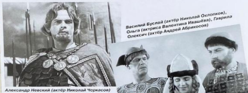
Александр Невский (актёр Николай Черкасов)

Для всех граждан Советского Союза, всех бойцов Красной армии, сражавшихся с фашистами во время Великой Отечественной войны 1941–1945 годов, этот фильм, наряду с военными стихами, песнями, документальными фильмами, плакатами, стал всенародно любимым и помог нашему народу победить врага.