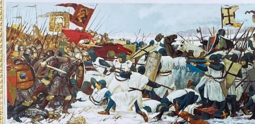
Худож. В.В. Маторин. Ледовое побоище. Слева — русское войско. Выделяется фигура князя в красном облачении. Над войском — знамена-хоругви

Из «Истории Государства Российского» Н.М. Карамзина: «Между тем [1240] немцы вступили в область новгородскую... Народ, видя беду, требовал себе заступника от Ярослава Всеволодовича... В 1241 году Александр прибыл, и всё переменялось. Немедленно собралось войско: новгородцы, ладожане, корелля, ижорцы всею шлю под его знаменами к Филскому заливу; взяли Конорье и пленили многих немцев. <...>