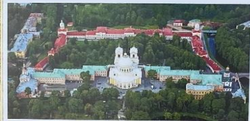
Свято-Троицкая Александро-Невская лавра – у впадения Черной реки в Неву