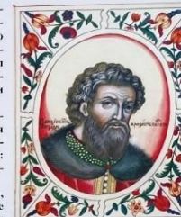
Александр Невский. Миниатюра из «Дорского титулярника», 1672

«Сия достопамятная битва, оборотив тогда всё наше горестное отечество, дала Александру славное прозвание Невского. Обстоятельства её тем для нас любопытнее, что летописцы, служа ему князю, слышали их от него самого и других очевидцев». 2