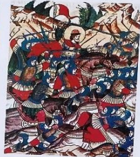
Александр Ярославич ранит в лицо Биргера