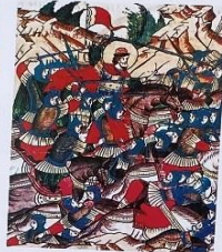
Александр Ярославич ранит в лицо Биргера