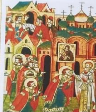
Молитва Александра Невского в храме Св. Софии и благословение его архиепископом перед битвой