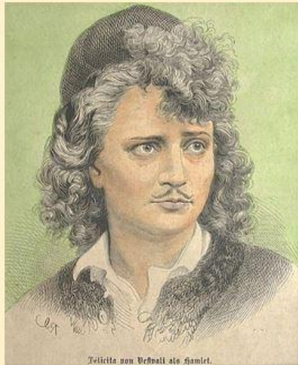
Ф. фон Вестфали

В 60-х – 90-х годах XIX века датского принца стали играть женщины. Эта новация вызвала негодование общественности. Фелицита фон Вестфали стала первой женщиной, сыгравшей Гамлета. Это было в 1867 году. Эту же роль исполняли Фелицита Абт, Сара Бернар, Сюзанна Депре. Подход к исполнению отличался: если С.Бернар оттачивала каждое движение и заучивала каждую интонацию, С. Депре придерживалась простоты и естественности.