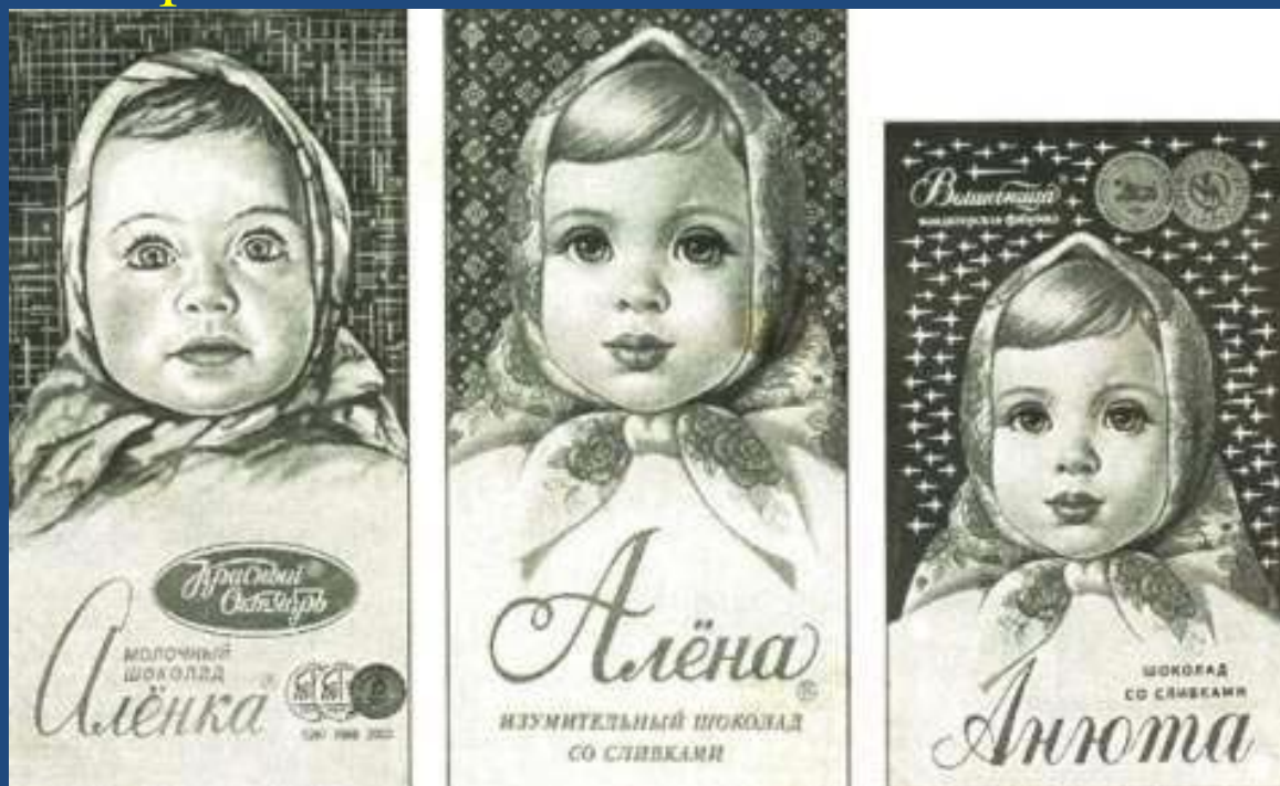
Рис. 5. Приклад недобросовісної конкуренції з боку кондитерської фабрики «Волшебница» («Чарівниця») із селища Малаховка Московської області (Росія), яка відверто скопіювала зовнішній вигляд популярного серед споживачів колишнього СРСР шоколаду «Алєнка» для власної продукції (шоколаду «Алєна» і «Анюта»)*.

Недобросовісна конкуренція – це будь-які дії в конкуренції, які суперечать правилам, торговим чи іншим чесним звичаям у підприємницькій діяльності.