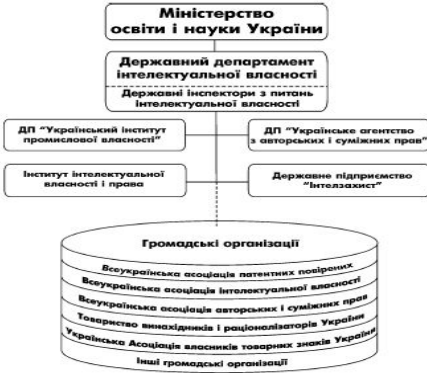
Рис. 7. Структура державної системи правової охорони інтелектуальної власності.