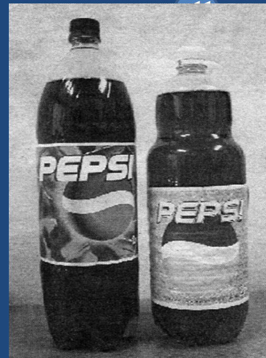
Рис. 6. Приклад знаку «Pepsi!», що може ввести в оману щодо відомого напою «Pepsi».

Рис. 5. Приклад недобросовісної конкуренції з боку кондитерської фабрики «Волшебница» («Чарівниця») із селища Малаховка Московської області (Росія), яка відверто скопіювала зовнішній вигляд популярного серед споживачів колишнього СРСР шоколаду «Алєнка» для власної продукції (шоколаду «Алєна» і «Анюта»)*.