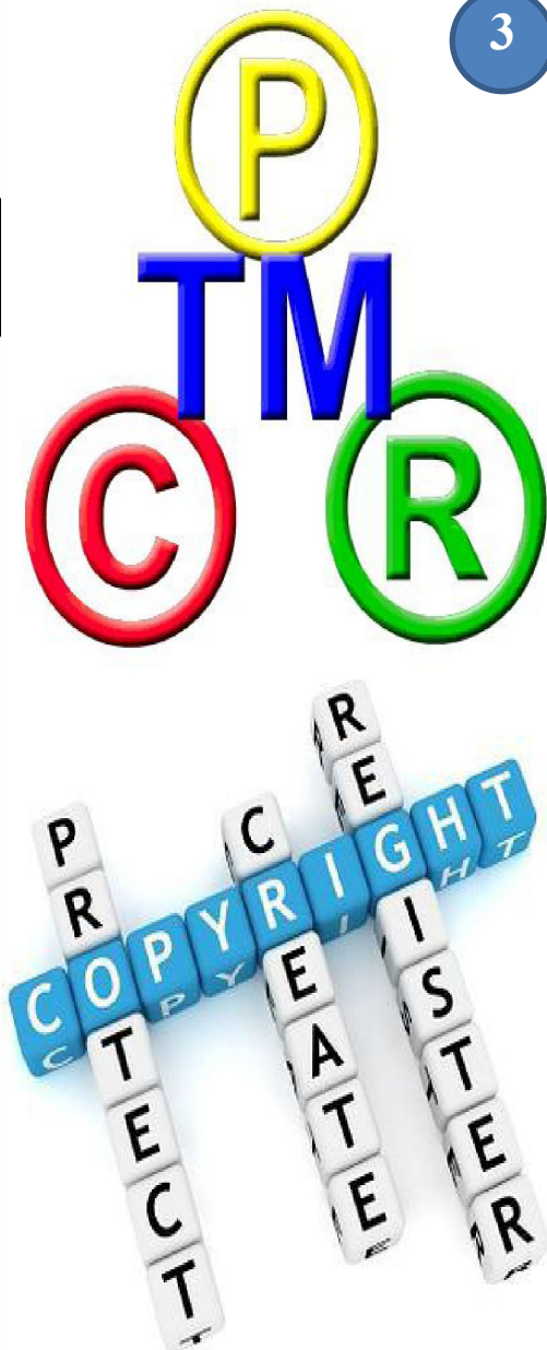
Рис. 1 Об'єкти права інтелектуальної власності.