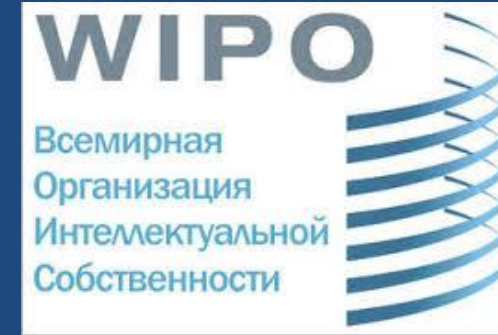
Рис. 8. Емблема Всесвітньої організації інтелектуальної власності ВОІВ.

Всеукраїнська організація інтелектуальної власності має міжвідомчий характер. Вона сприяє доведенню основних проблем, що існують у сфері інтелектуальної власності, до відома законодавчої та виконавчої гілок влади.