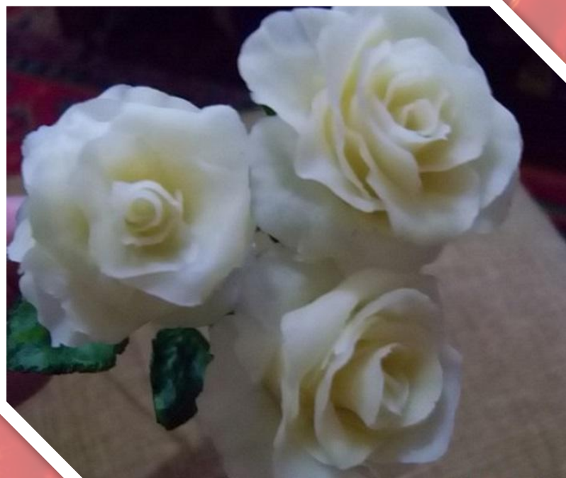
Интерьерный букет цветов.