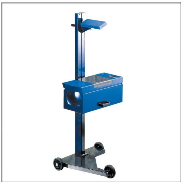
Прибор для проверки фар