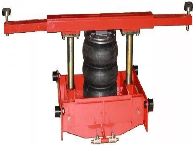
Подъемник для вывешивания автомобилей