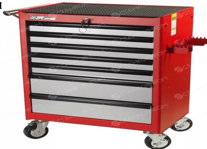
Тележка с набором инструментов для ремонта авто