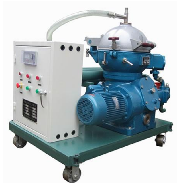
Установка для очистки центробежных фильтров