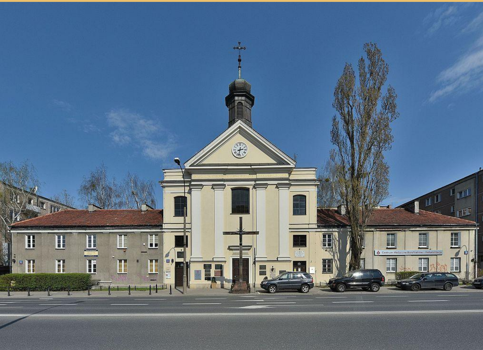
Kościół św. Jana Bożego w Warszawie (Leszno) 1650

Józef II Fontana herbu Fontana (urodzony w 1676 w Mendrisio (Szwajcaria), zmarł w 1739 w Warszawie) – polski architekt pochodzenia włoskiego. W jego pracach widać nawiązanie do barokowego klasycyzmu. Syn Józefa - również architekta.