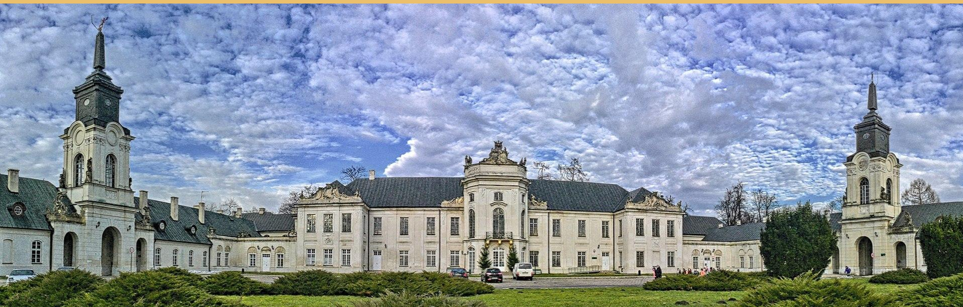
Radzyń Podlaski Eustachego Potockiego, ok. poł. XVIII w.