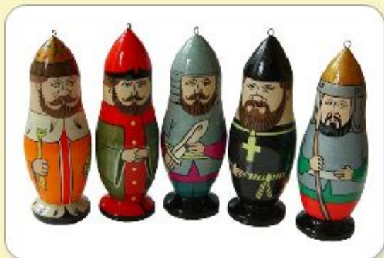
Сословия России. Деревянные фигурки.