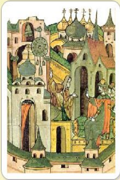
Высшее черное духовенство. Старинная миниатюра