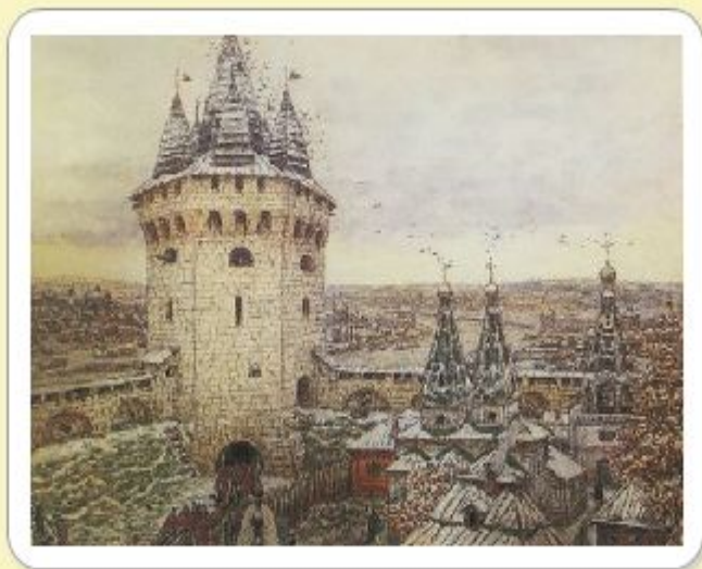
Стена Китай-города, защищавшая московский посад