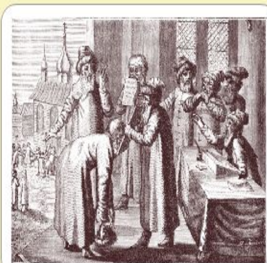
Принесение присяги перед службой