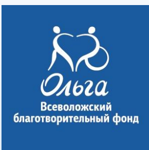
Фото-отчет о проекте «Мы тоже можем»