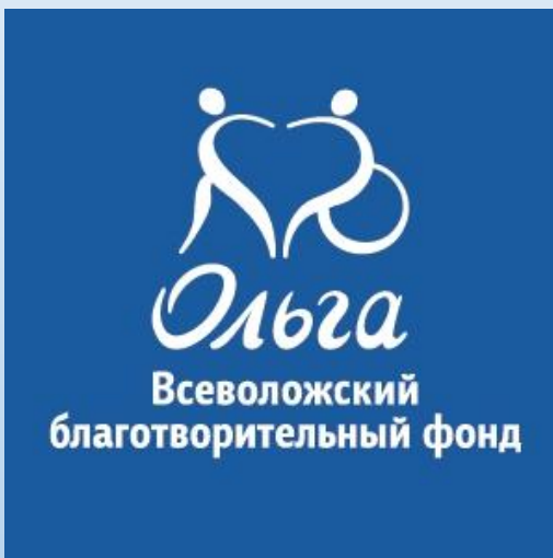
Фото-отчет о реализации мероприятий проекта «Мы тоже можем»

Всеволожский благотворительный фонд помощи детям-инвалидам и детям с ОВЗ «Ольга»