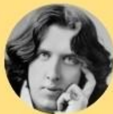
Оскар Уайльд «Портрет Дориана Грея»

«Всякий портрет, написанный с любовью, - это, в сущности, портрет самого художника, а не того, кто ему позировал.»