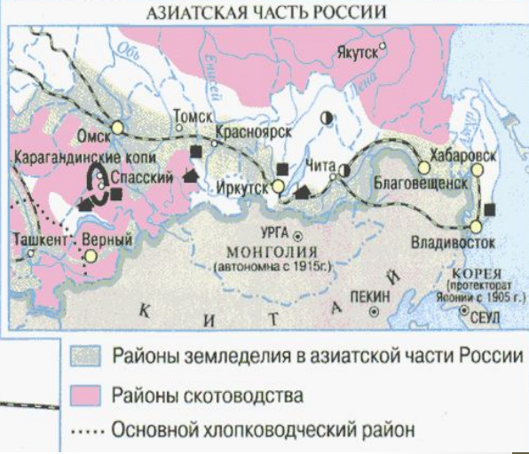
Экономическое развитие России в начале XX в.