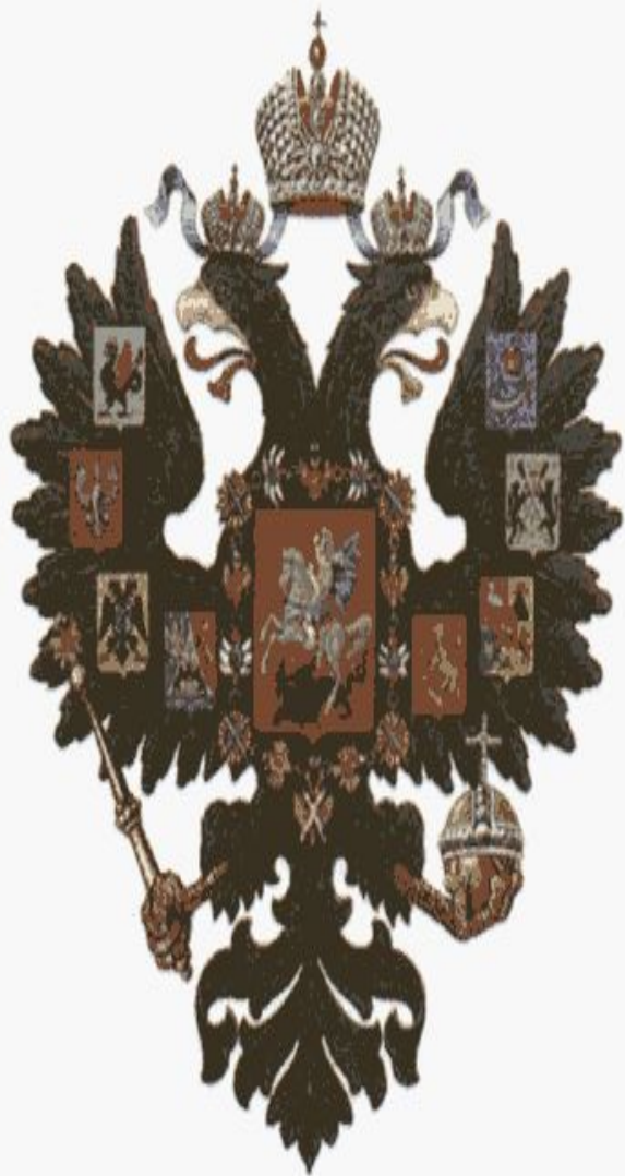
Герб Российской империи. Начало XX в.

Поначалу монополии в России складывались в форме синдикатов — объединений, в которых каждое отдельное предприятие сохраняло производственную автономию, теряя при этом право самостоятельно сбывать свою продукцию. Затем, уже в XX в. стали возникать тресты — объединения, в которых отдельных предприятий как таковых уже не существовало. Все они подчинялись единому руководству и сливались в единую производственную систему, каждая часть которой была неразрывно связана с целым.