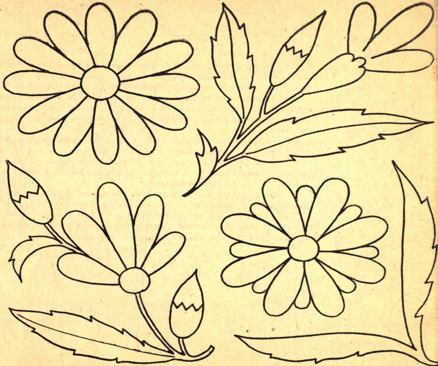
Стилизация цветов, листьев, бутонов ромашки