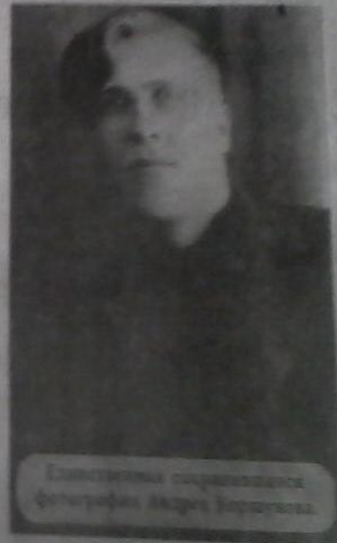
Сопоставлены сфотографированные фотографии Андрея Коршунова.