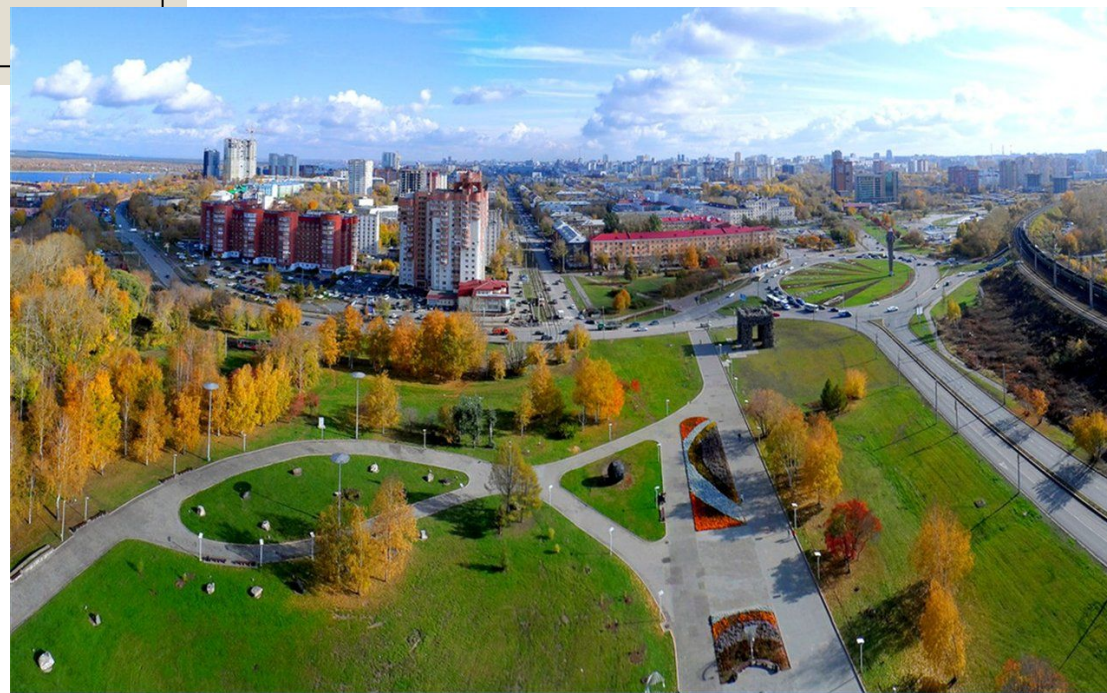
Пермь ВКонтакте vk.com/vikiperm