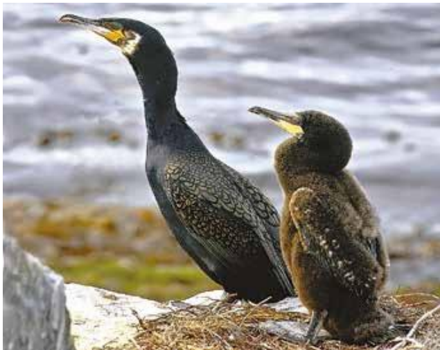
Большой баклан атлантически