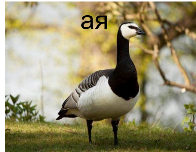
Черная казарка атлантическ