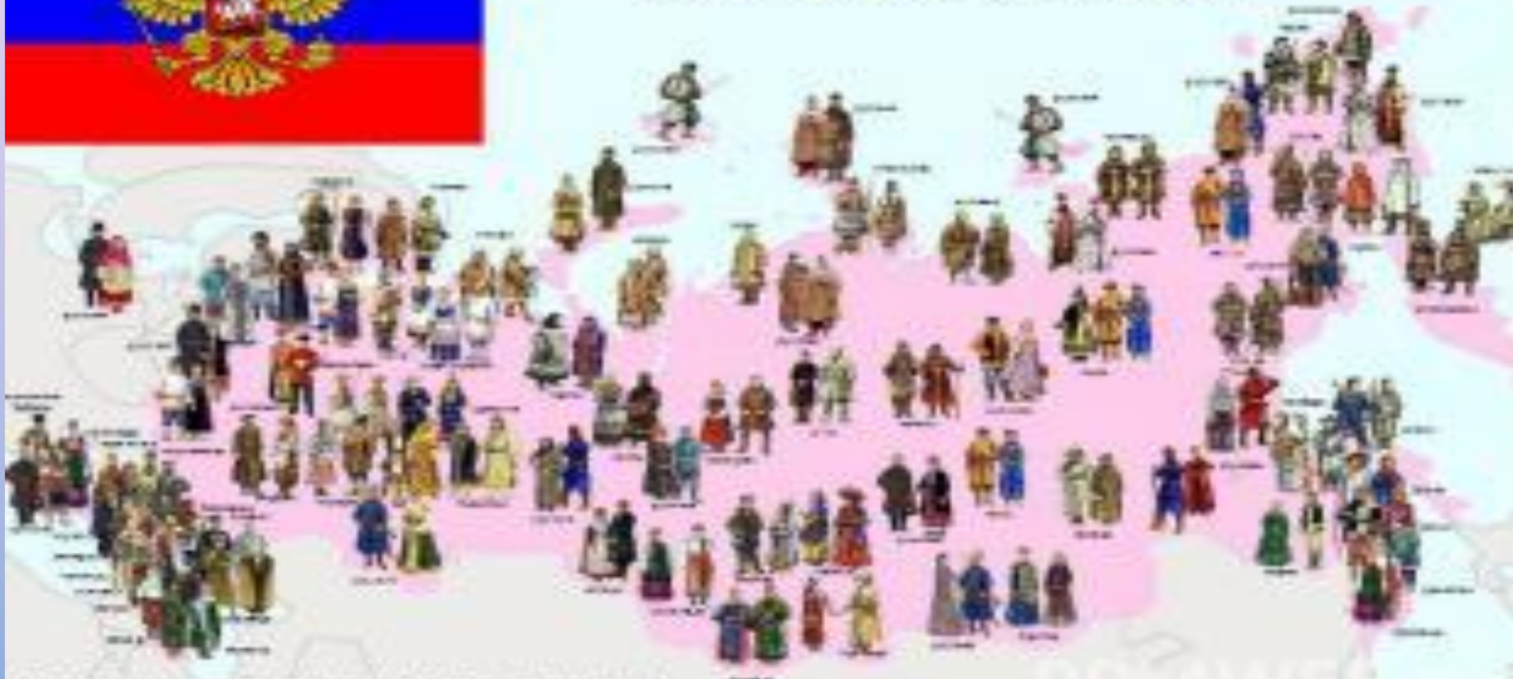
Карта для детей дошкольного возраста. Составлена Волкова И. А.