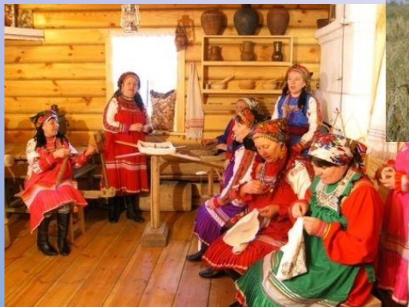
Самобытность малочисленных народов Севера коллектив