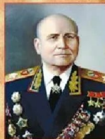
КОНЕВ Иван Степанович (1897 - 1973)