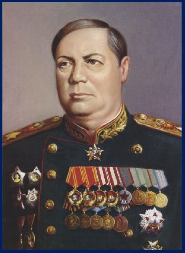
Толбухин Федор Иванович (1894-1949)

В памяти сослуживцев и подчиненных запечатлелись такие замечательные черты этого доблестного сына России, как верность долгу и беспредельная преданность Родине, добросовестность и трудолюбие. Для успешного руководства войсками немаловажное значение имели его большой опыт оперативной работы, глубокое понимание ее сущности и важности. По умению опереться на свой штаб, максимально использовать его возможности вряд ли можно сыскать равного Федору Ивановичу среди командующих фронтами Великой Отечественной войны. Демократизм начальника в повседневной жизни, при выработке решения на операцию сочетался с его твердостью и настойчивостью при достижении поставленной цели.