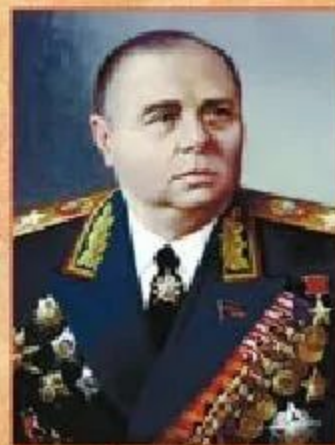
МЕРЕЦКОВ Кирилл Афанасьевич (1897 - 1968)