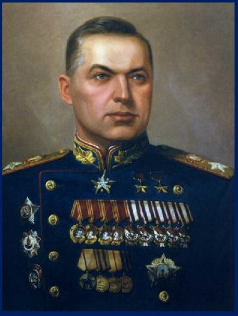
Константин Константинович Рокоссовский (1896-1968)

Черта полководческого таланта Константина Константиновича Рокоссовского — способность к разумному риску, что являлось неоценимым качеством советских полководцев. Одна из замечательных страниц полководческой деятельности К. К. Рокоссовского — Белорусская операция, в которой он командовал войсками 1-го Белорусского фронта. Дважды Герой Советского Союза, Маршал Советского Союза