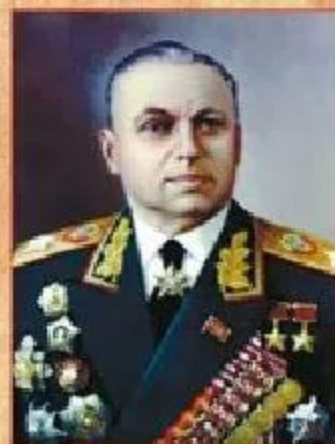
РОКОССОВСКИЙ Константин Константинович (1896 - 1968)