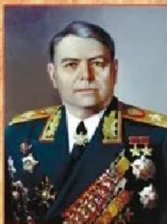
ВАСИЛЕВСКИЙ Александр Михайлович (1895 - 1977)