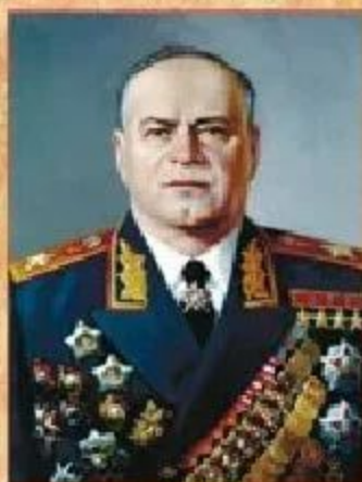
ЖУКОВ Георгий Константинович (1896 - 1974)