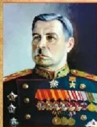
ГОВОРОВ Леонид Александрович (1897 - 1955)