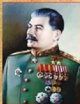
СТАЛИН Иосиф Виссарионович (1879 - 1953)