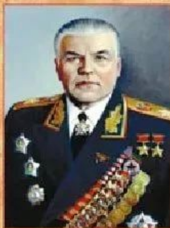
МАЛИНОВСКИЙ Родion Яковлевич (1898 - 1967)