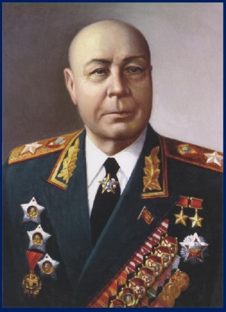
Тимошенко Семён КонстантиновичА (1895-1970)

Испытав на себе весь гнев Сталина в первые дни кошмарных провалов на фронтах, Тимошенко Семён КонстантиновичА попросил направить его на наиболее опасный участок. Впоследствии маршал командовал стратегическими направлениями и фронтами. Под его командованием шли тяжелые оборонительные бои на территории Белоруссии в июле - августе 1941 года. С его именем связаны героическая оборона Могилева и Гомеля, контрудары под Витебском и Бобруйском. Под руководством Тимошенко развернулось самое большое и упорное сражение первых месяцев войны - Смоленское. В июле 1941 г. войска Западного направления под командованием маршала Тимошенко остановили наступление группы армий "Центр" ..