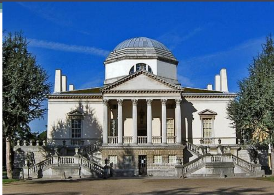
Окрестности Лондона. 1725 г.