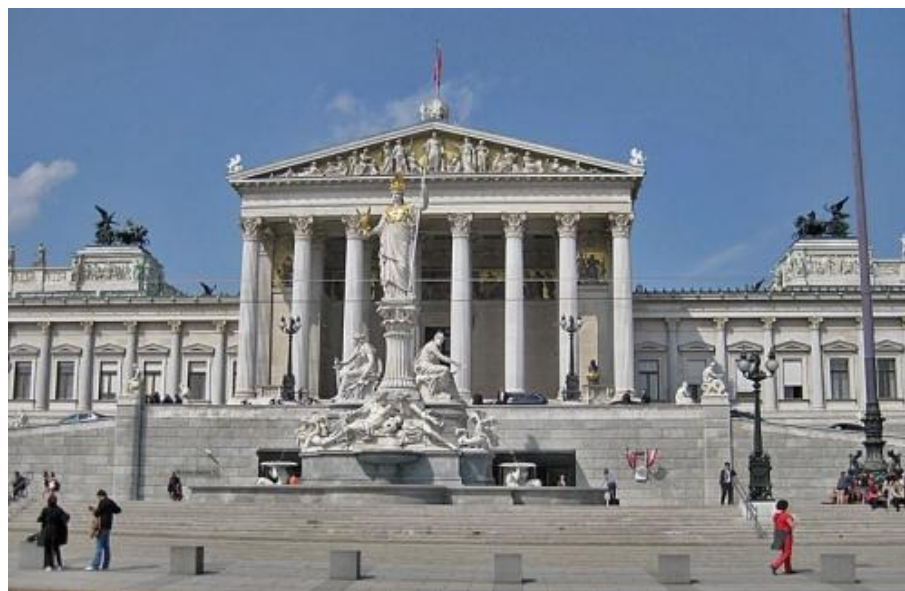
Венский парламент (Parlamentsgebäude) в стиле неоклассицизм