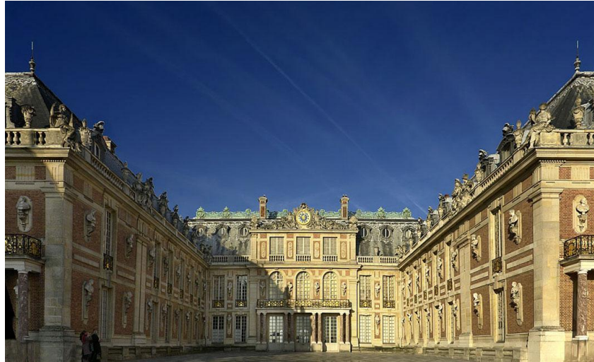
Версальский дворец. Парковый комплекс