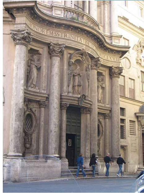
Церковь в Риме San Carlo alle Quattro Fontane или Сан Карлино. Арх. Франческо Борромини

Базилика Святого Петра (лат. Basilica Sancti Petri , итал. Basilica di San Pietro ) — католический собор, центральное и наиболее крупное сооружение Ватикана