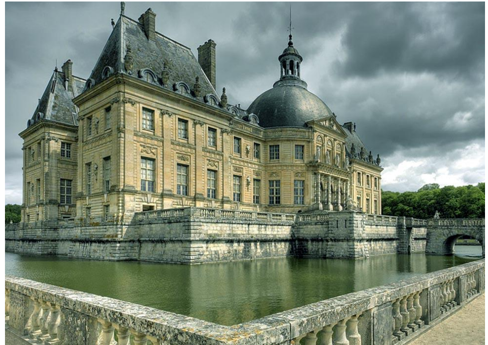
Усадьба-дворец Во-ле-Виконт 1658 Милен