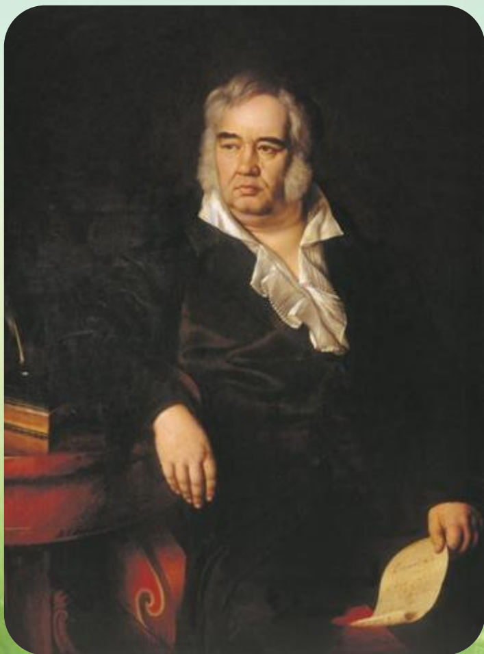
Иван Андреевич Крылов (1769-1844)