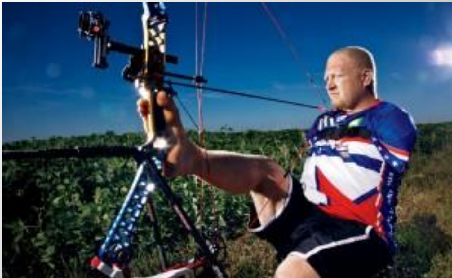
Мэтт Штуцман, безрукий чемпион по стрельбе из лука