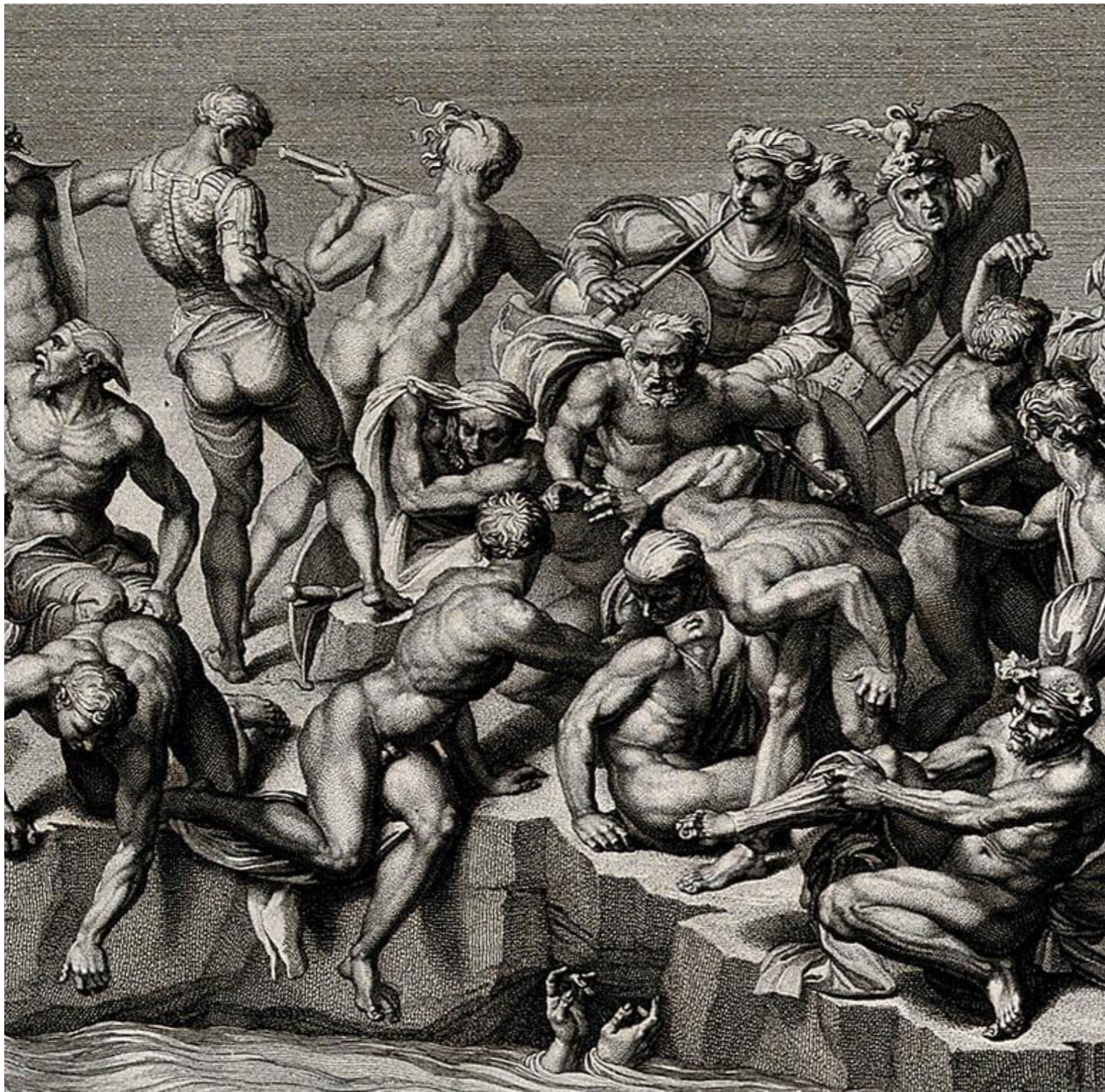
Битва при Кашине при Ангиари