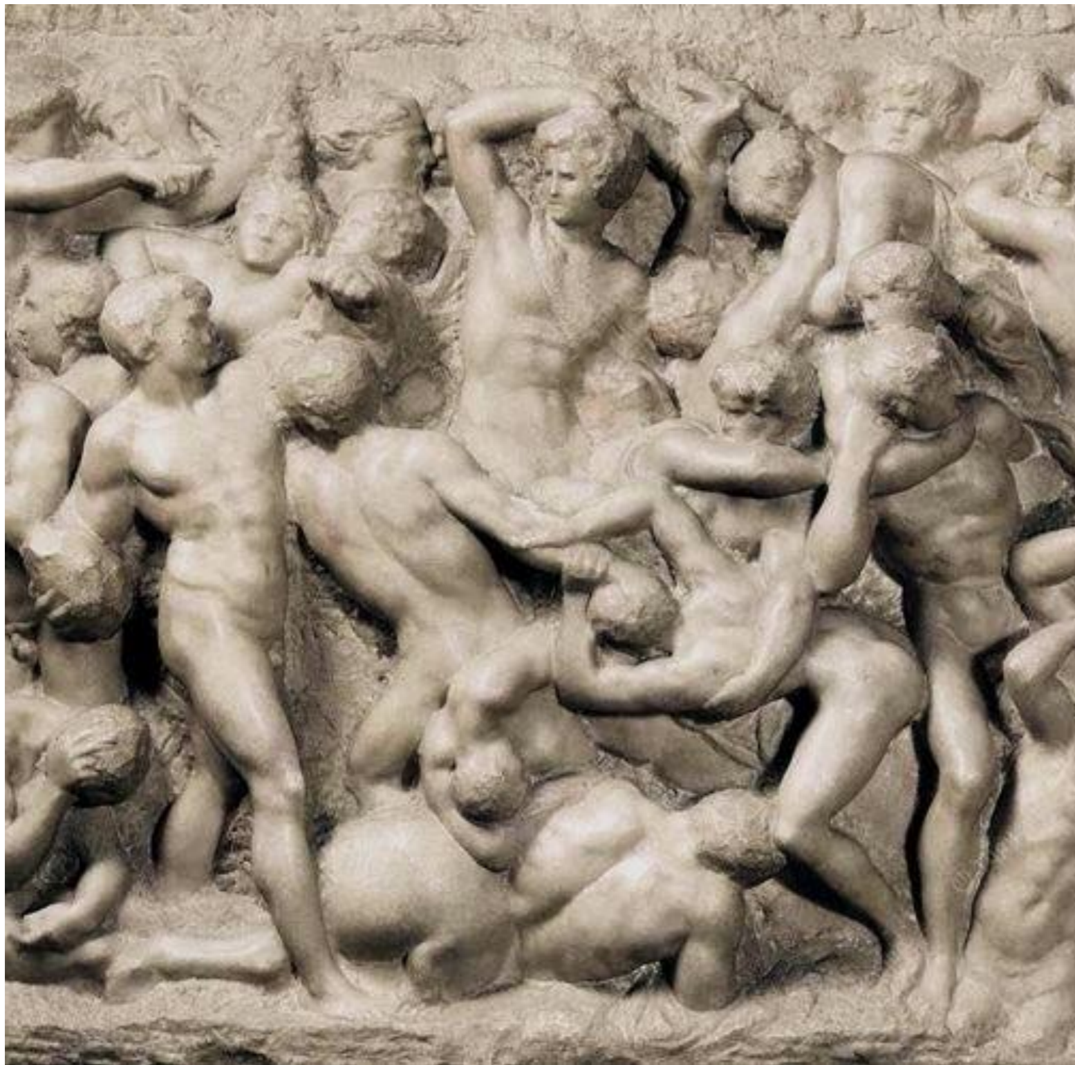
Битва Геркулеса с кентаврами лестнице