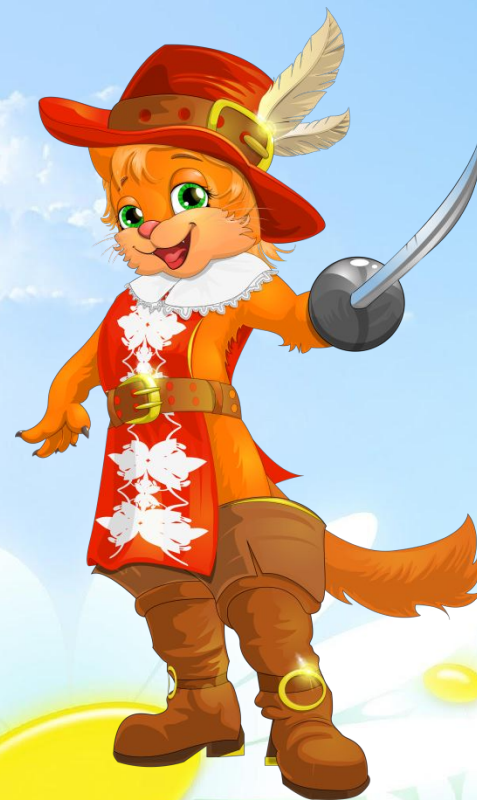
КОТ В САПОГАХ