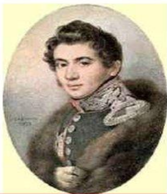
Никита Михайлович Муравьев