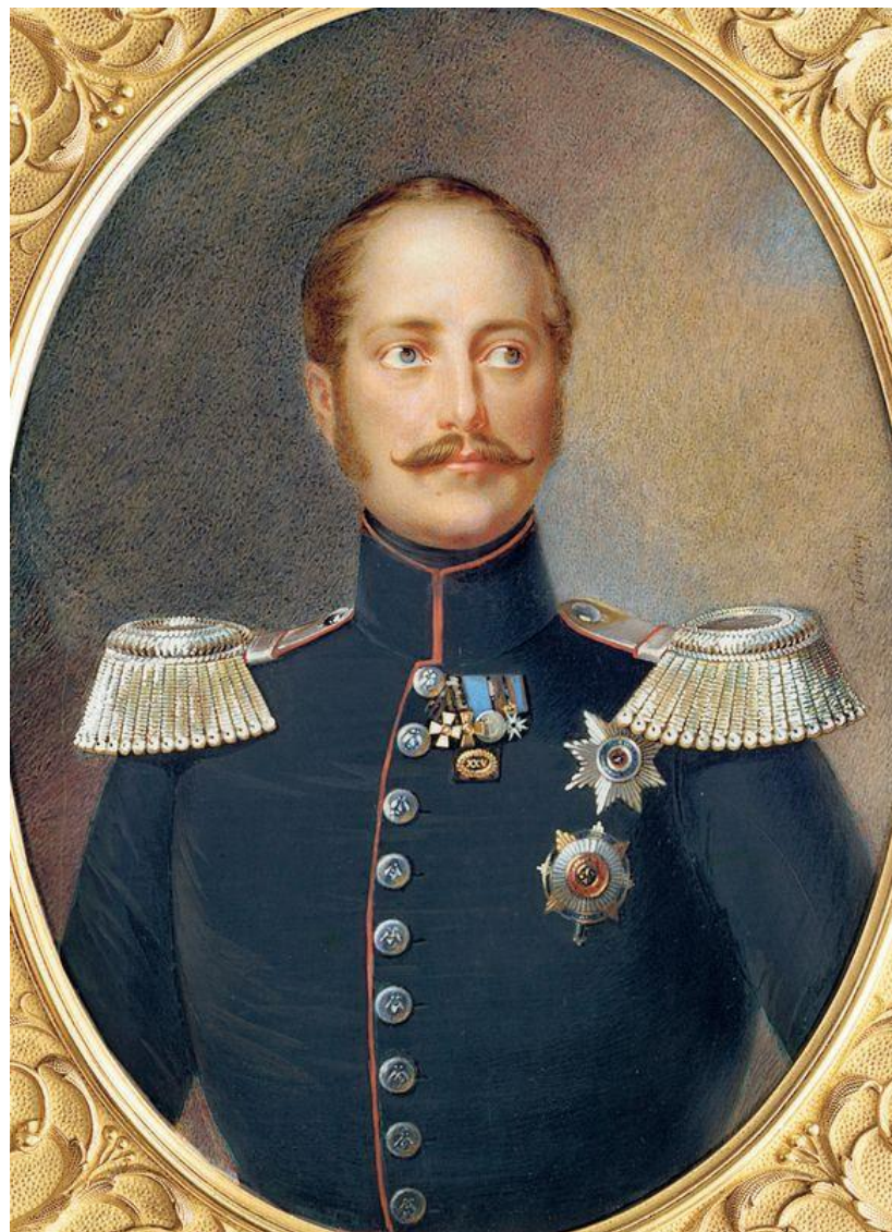
НИКОЛАЙ I ( 1796- 1855 ГГ.)