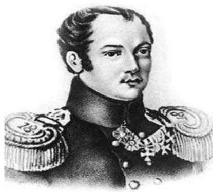
Павел Иванович Пестель