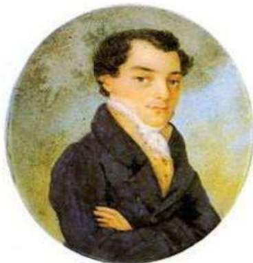
Кондратий Федорович Рылеев