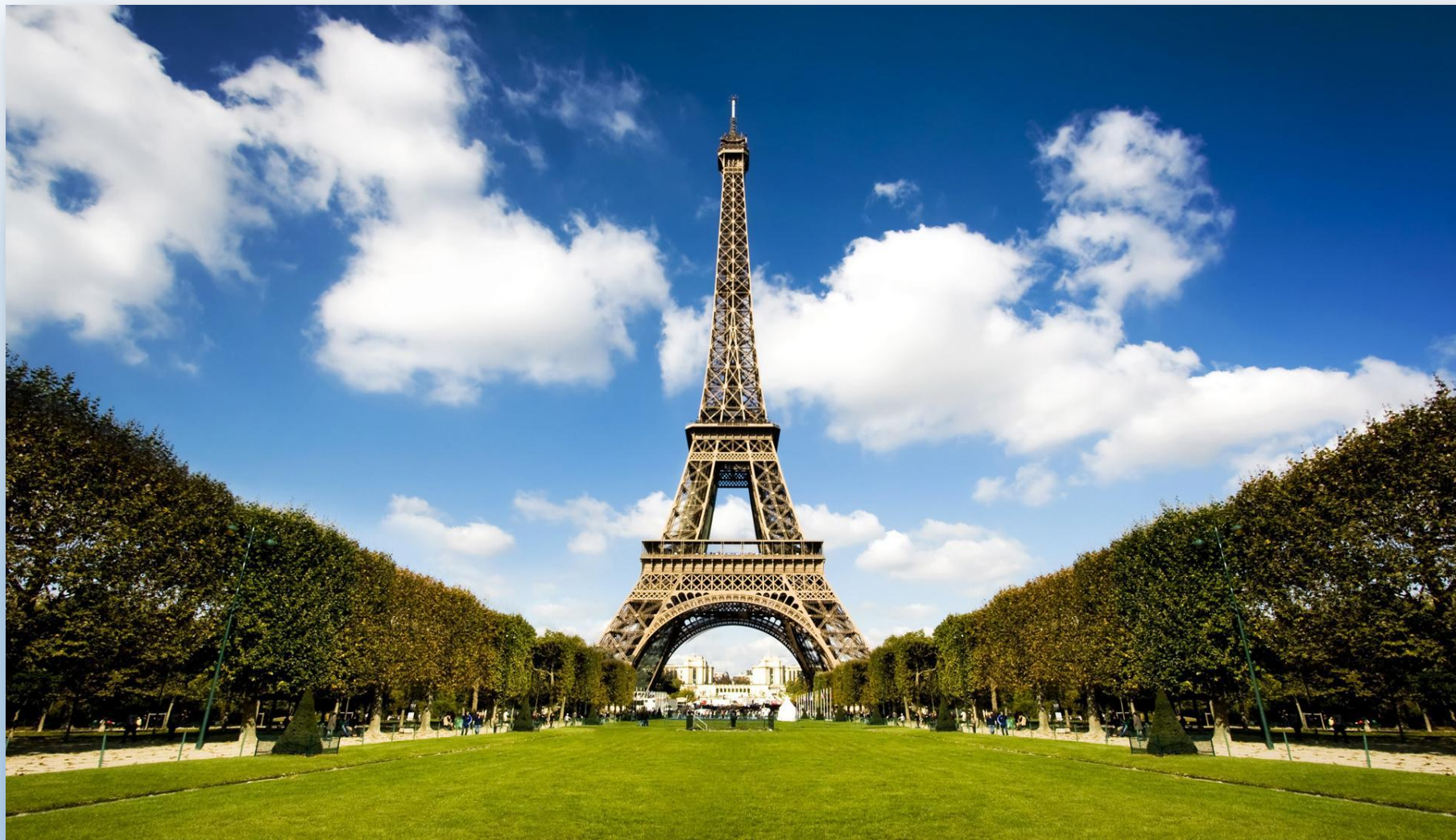
Марсове поле, Париж, Франція