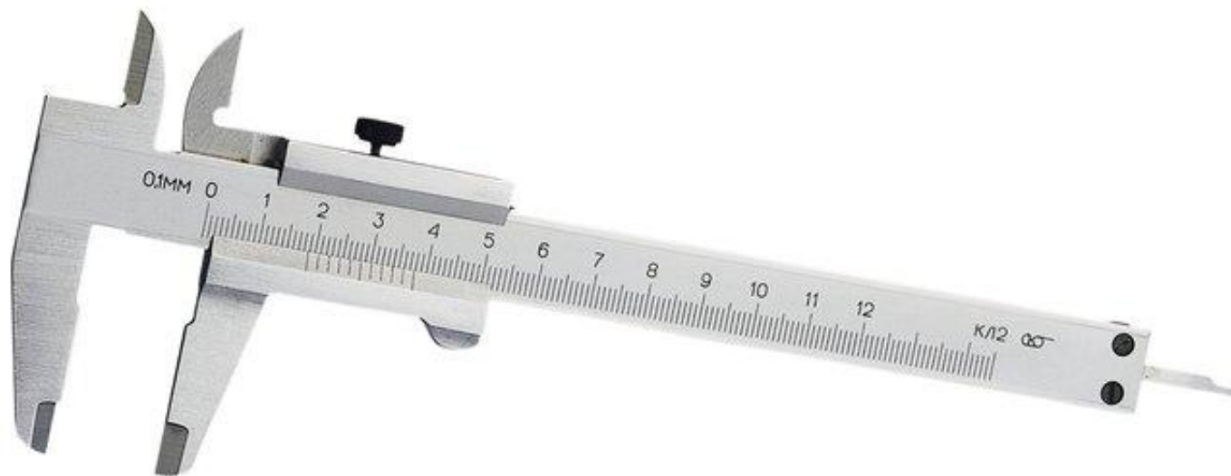
Штангенциркуль ШЦ - I