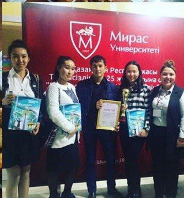
Мирас Университеті Ректоры кубогы. Жүлделі I орын.