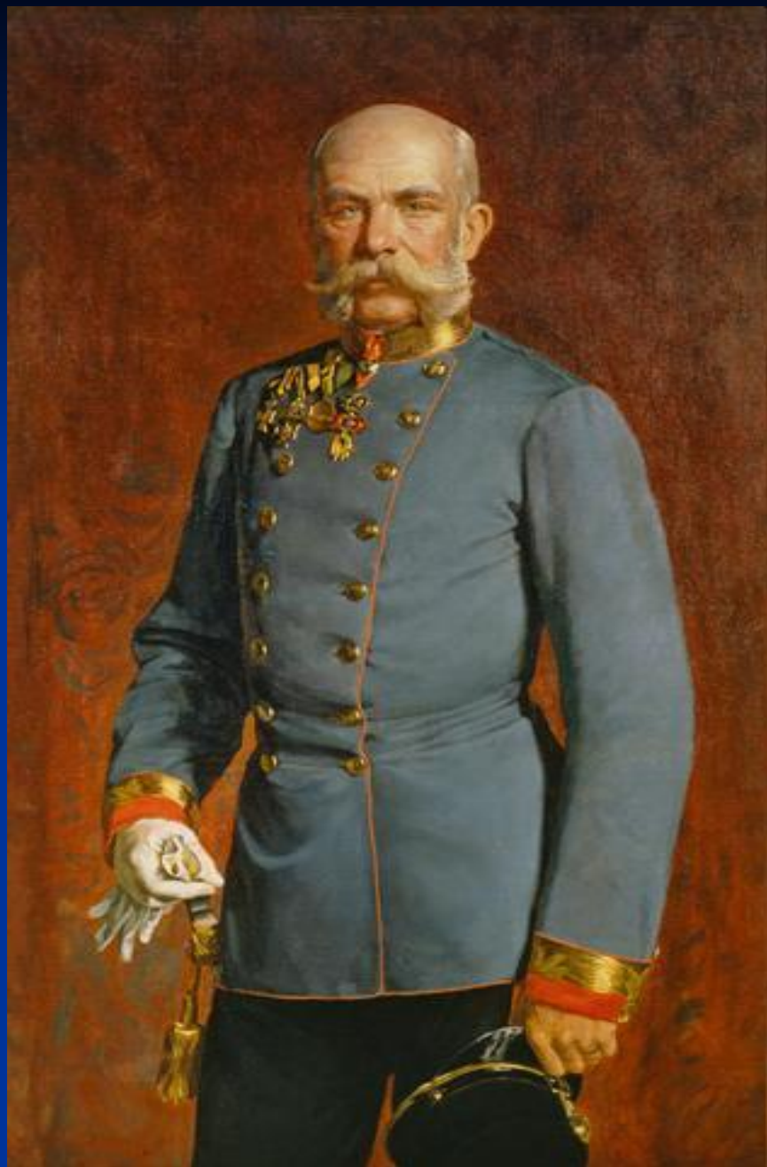
Император Франц Иосиф