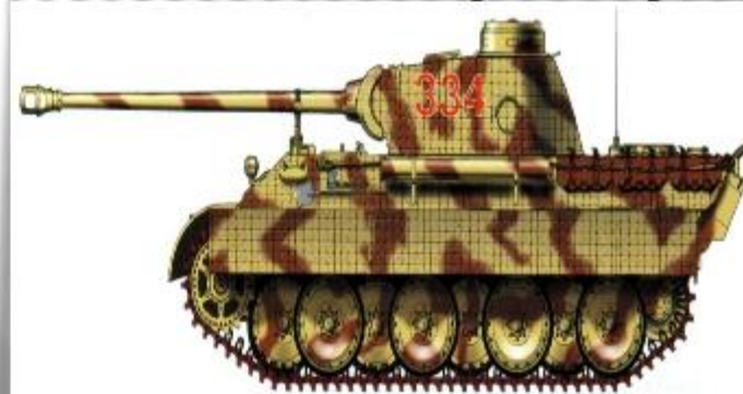
Немецкий танк Pz. V «пантера»