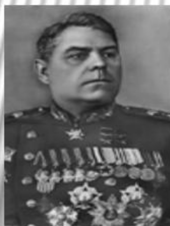
Василевский А.М., представитель Ставки