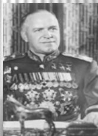
Жуков Г.К. представитель Ставки