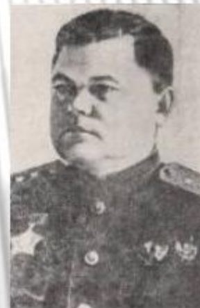
Н.Ф. Вагутин, командующий Воронежским фронтом