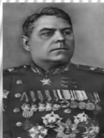
Василевский А.М., представитель Ставки