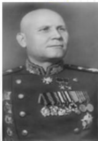
Конев И. С., командующий Степным фронтом