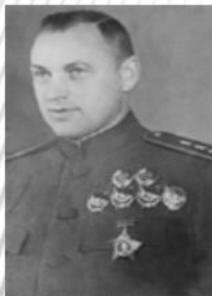
Рокоссовский К.К., командующий Центральным фронтом