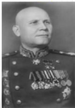
Конеv И. С., командующий Степным фронтом