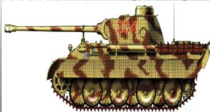
Немецкий танк Pz. V «пантера»