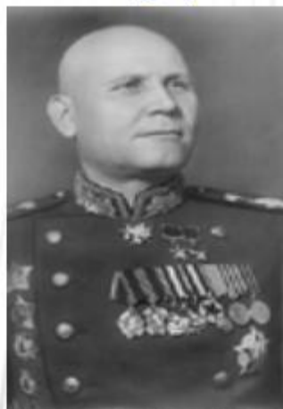
Конеv И. С., командующий Степным фронтом