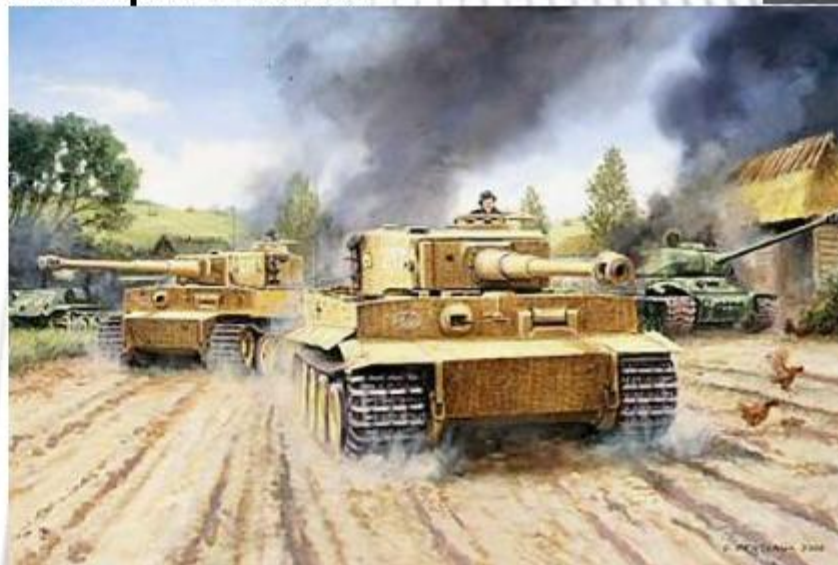
Танки Pz. VI «тигр» на марше.