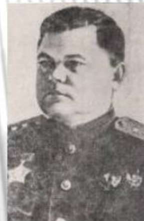
Н.Ф. Ватуин, командующий Воронежским фронтом