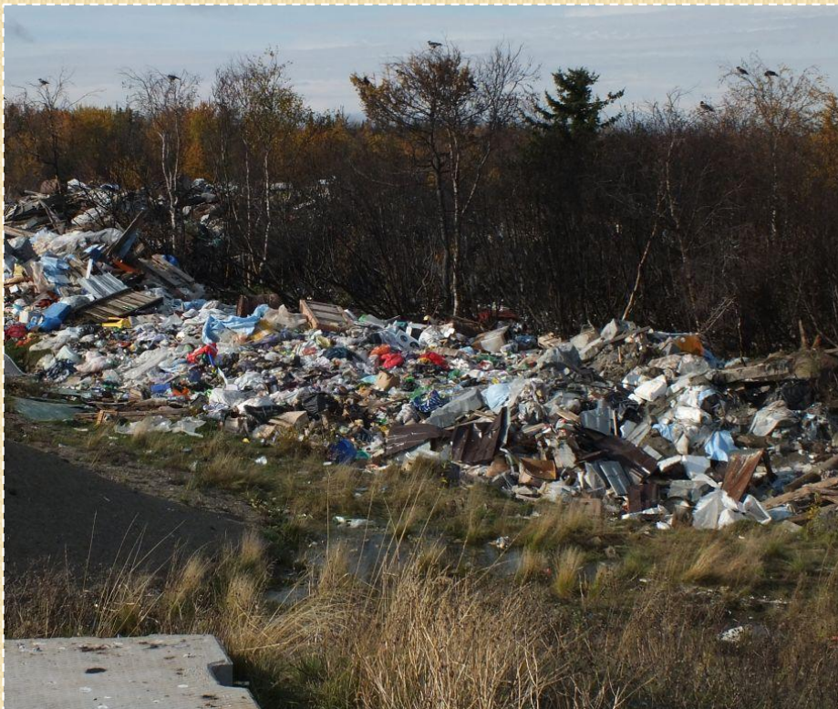
Станция 10. Мусоропере- рабатывающий завод