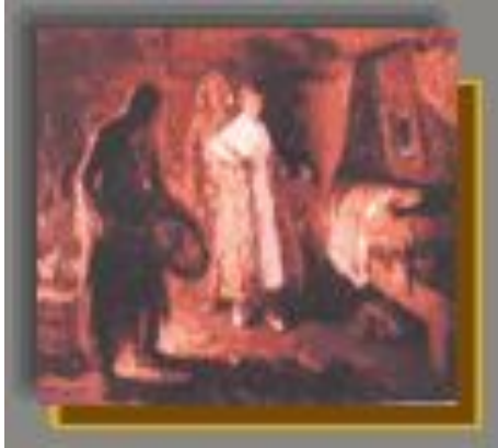
А.Осипов. Изгнание шамана.1957г.

В 30-х годах ожесточилась борьба с шаманством. Многие были вынуждены отречься от своего ремесла и глубоко прятать в себе дар, ниспосланный Природой. 50-е годы.