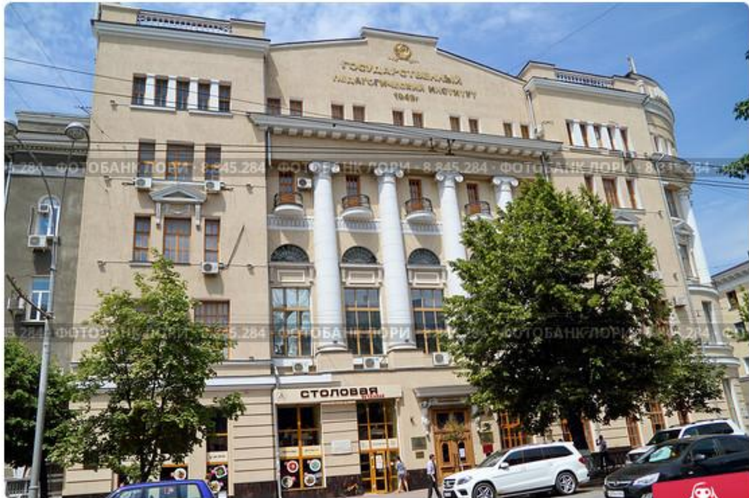
Ростов-на-Дону. Педагогический институт ЮФУ. Университет и Администрация