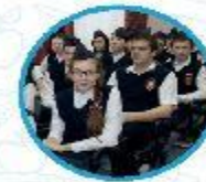
Юные помощники полиции

Профильные смены данного направления: ВДЦ «Океан», ВДЦ «Орленок»