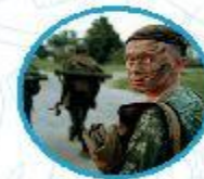
Юный спецназ Росгвардии