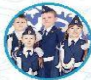
Юные инспектора движения