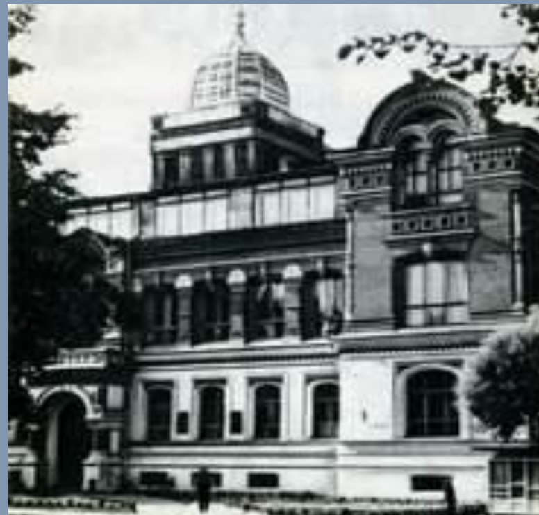
Второе здание КНИТУ-КАИ им. А.Н. Туполева в советское время