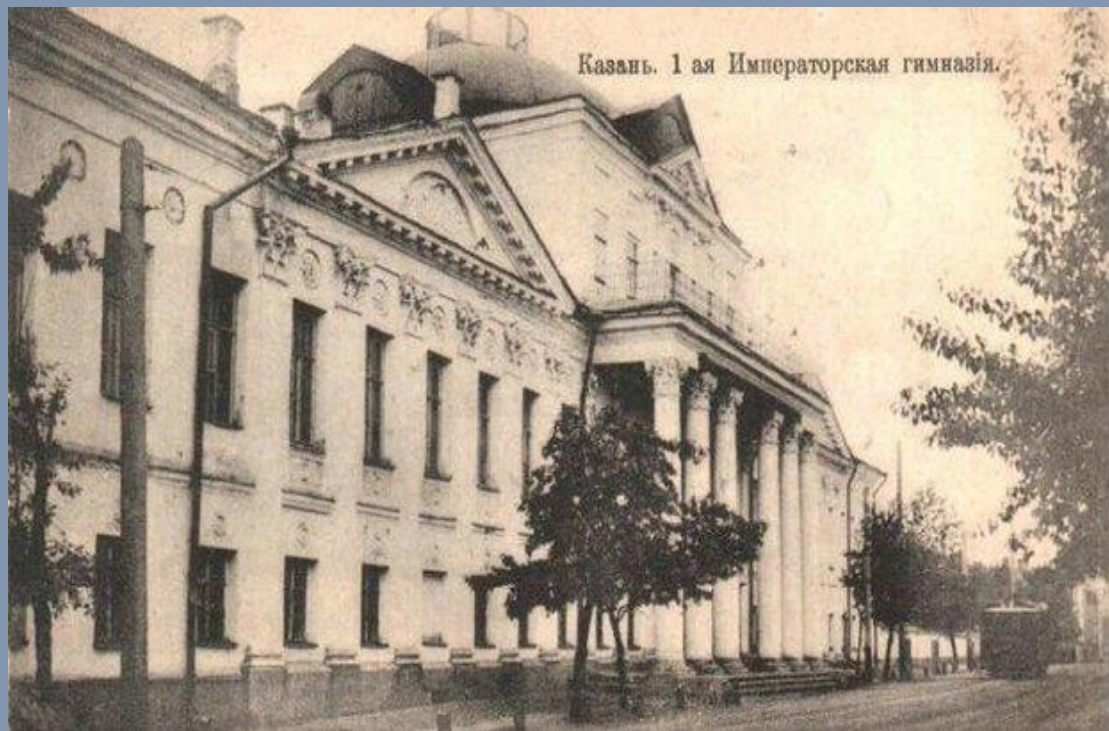
С 1932 года первое здание КНИТУ-КАИ им. А.Н. Туполева