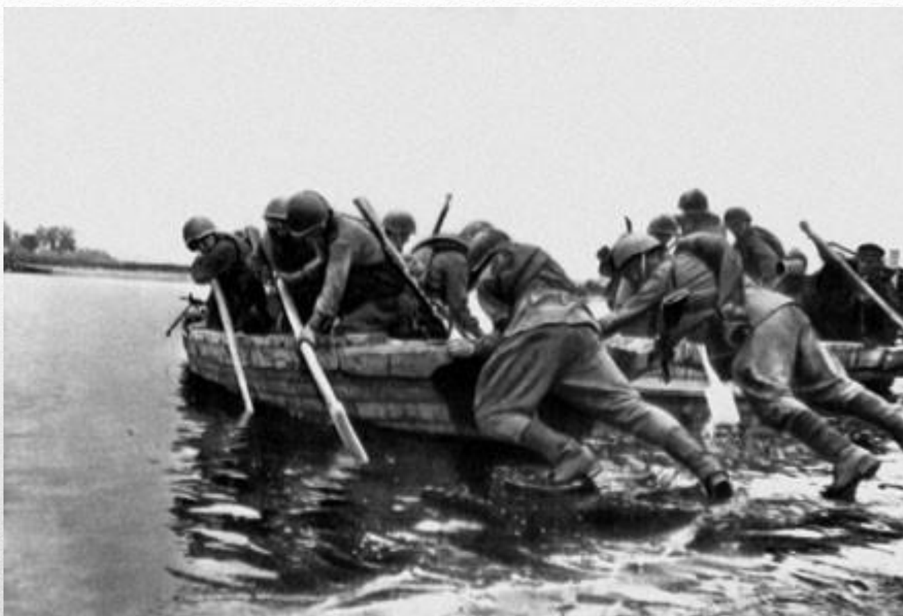
Форсирование Вислы 1944 год