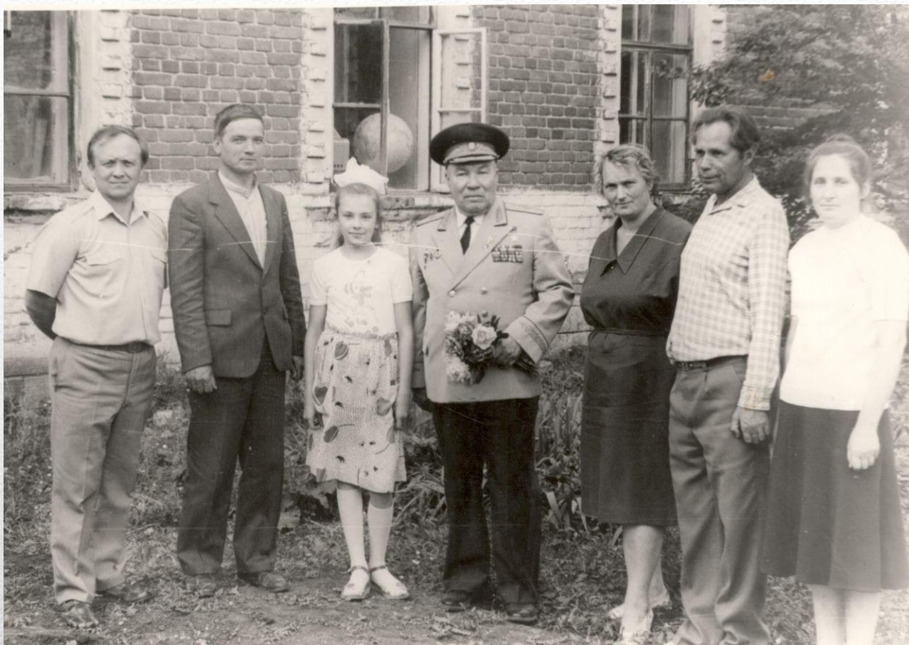
Встреча с земляками (с. Новый Буян 16.06.89)