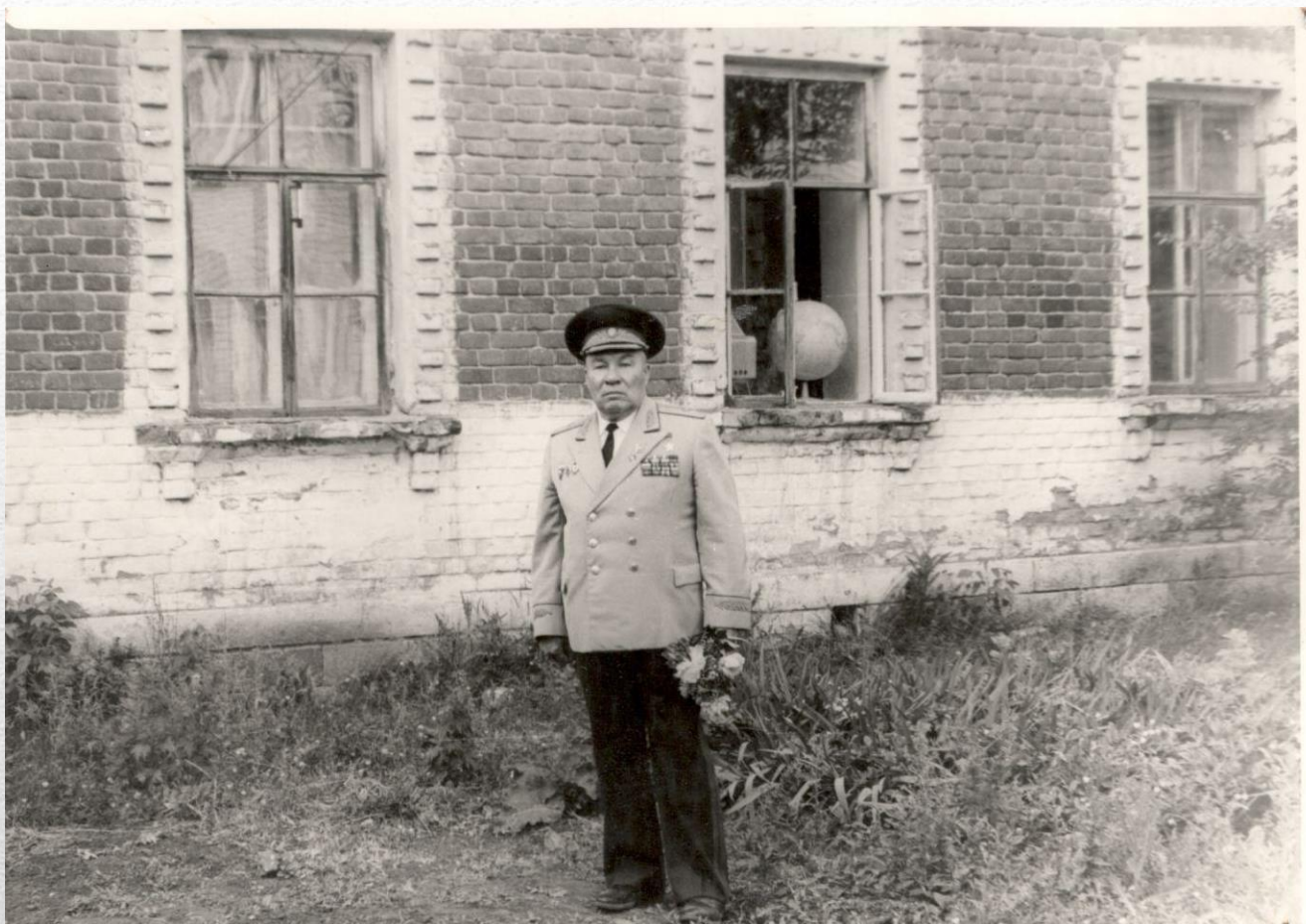
Около родной школы (с. Новый Буян 16.06.89)