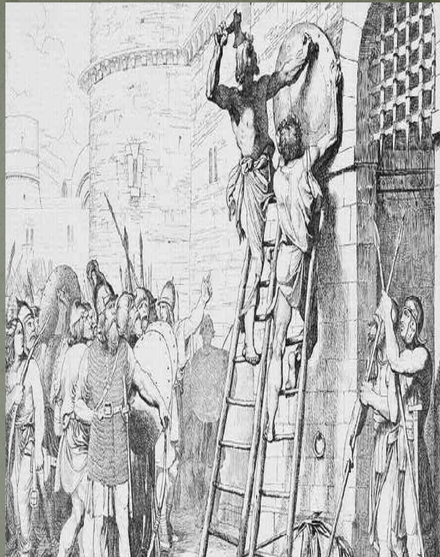
Покидая Константинополь, Олег прибил свой щит на ворота

“договором” 907 года из него исчезает упоминание о беспошлинной торговле. Олег именуется в договоре “великим князем русским”. В подлинности соглашения 911 года сомнений не возникает: она подкрепляется как лингвистическим анализом, так и упоминанием в византийских источниках.