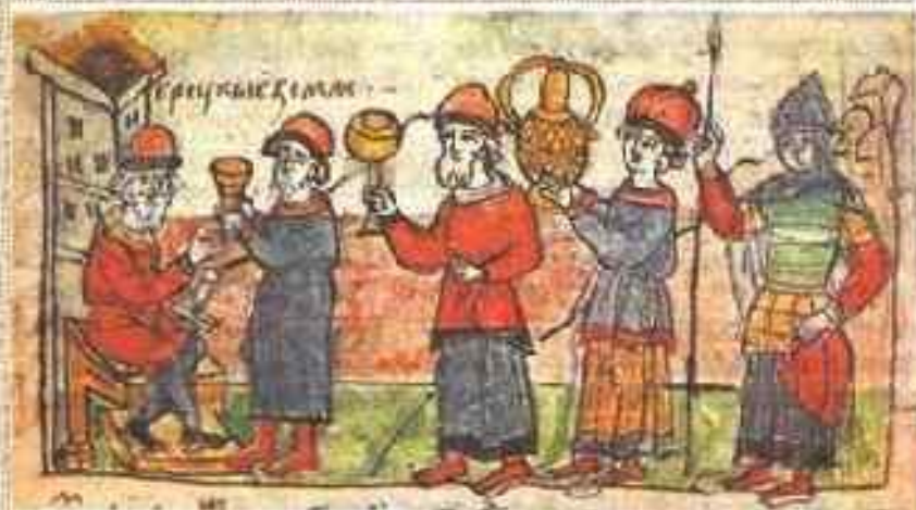
Византийцы приносят дары Игорю

В 944 году объединенное войско русичей, варягов и печенегов снова идут на юг. Узнав "о руси без числа", византийцы предложили мир на выгодных для русичей условиях..