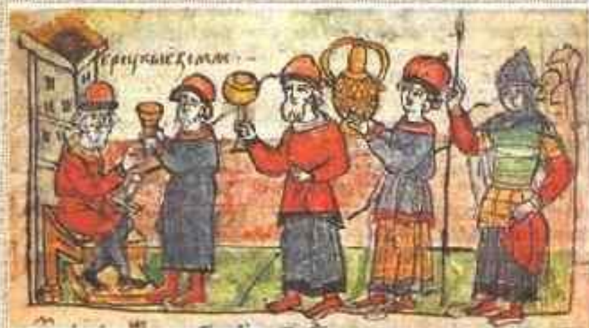
Византийцы приносят дары Игорю

В 944 году объединенное войско русичей, варягов и печенегов снова идут на юг. Узнав "о руси без числа", византийцы предложили мир на выгодных для русичей условиях..