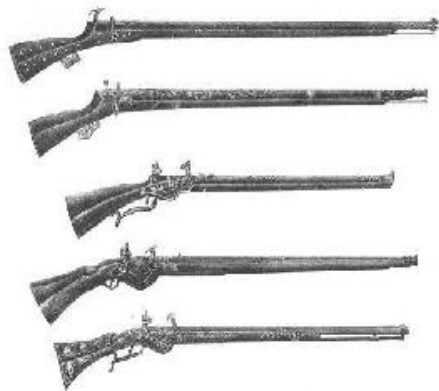
Оружие донских казаков XVI и XVII веков. Самый лучший образец.

Казаки в старину имели несколько наборов оружия: рабочее и парадное. Парадное добывали в бою у врага, держали в специальном лазе в землянке. Казаки не брезговали оружием врага, но предпочитали сабле шашку (имеет закругленное окончание). Казаки Дона били врага боевыми топориками, кистенем, шестопером, поясным и подсайдашным ножами. В 15 веке у казаков появилось огнестрельное оружие — самопалы. На вооружении донских казаков с XV по XVII вв. были: ручная кулеврина (ручница), ручная пищаль с боковой полкой, русский фитильный мушкет, багинет, бердыш-ружье, казачий колесцовый пистолет 1610 г. итальянского образца