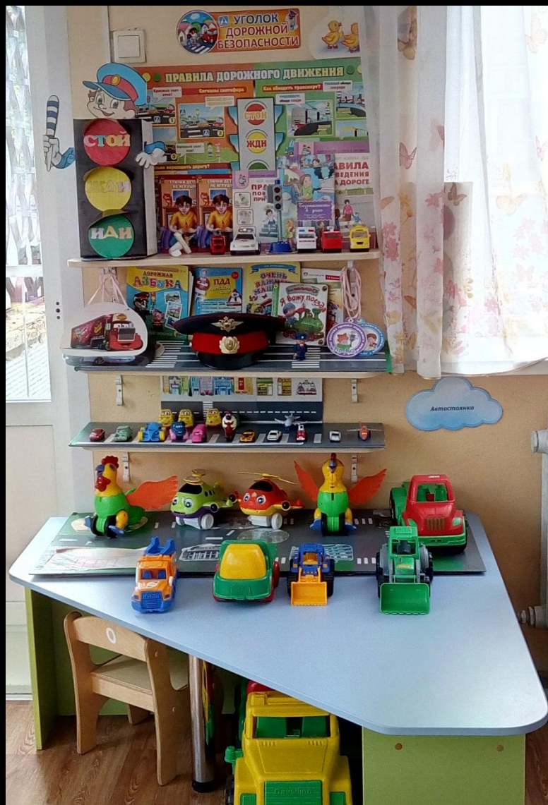
Уголок дорожной безопасности + автостоянка