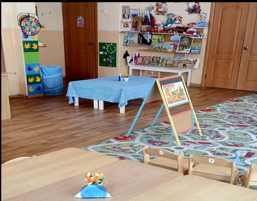
Вход в группу, нижняя левая точка