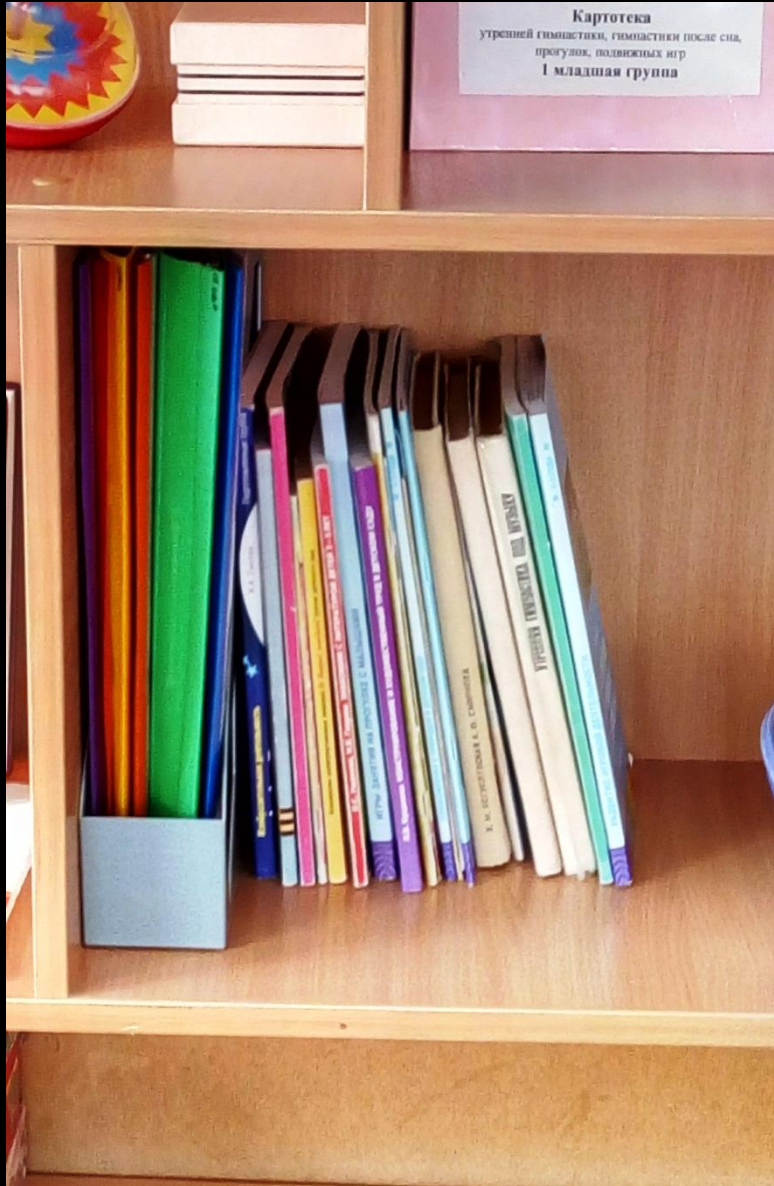
1.6. Рабочий сектор (методическая литература педагога)