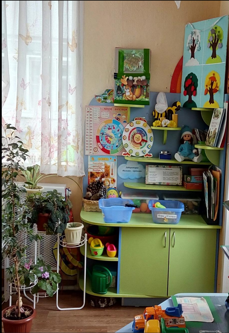
Уголок природы и экспериментирования