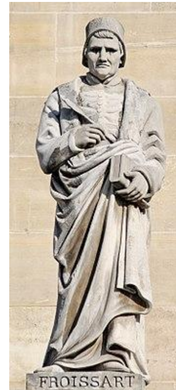
Жан Фруассар 1337-1410