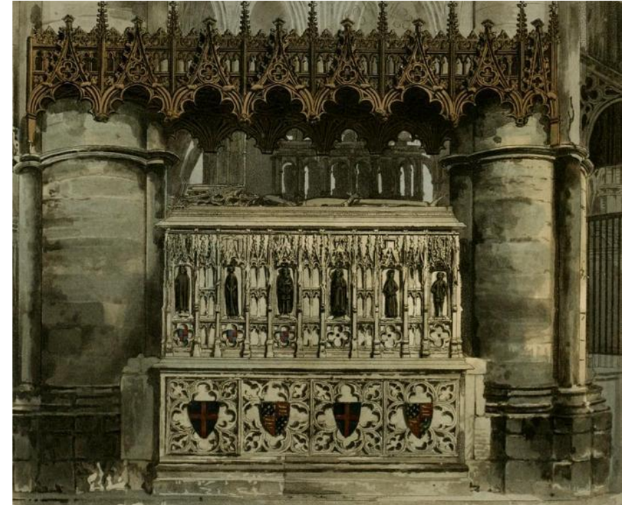
Могила Эдуарда III и Филиппы де Авен