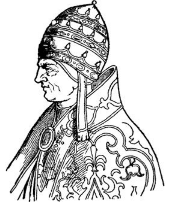
Урбан V 1310-1370