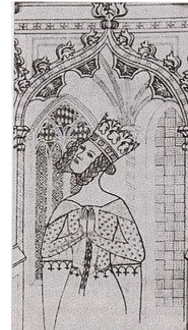
Филиппа де Авен 1314 - 1369