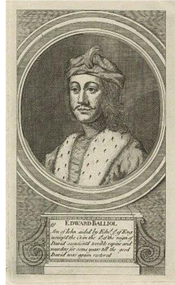
Эдуард Баллиоль 1283-1367