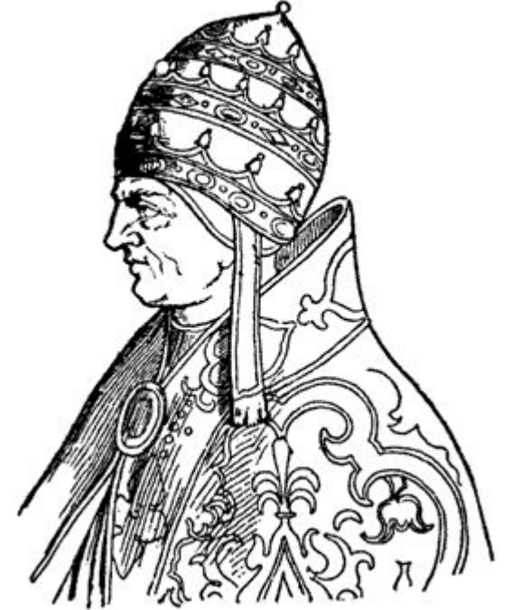
Урбан V 1310-1370