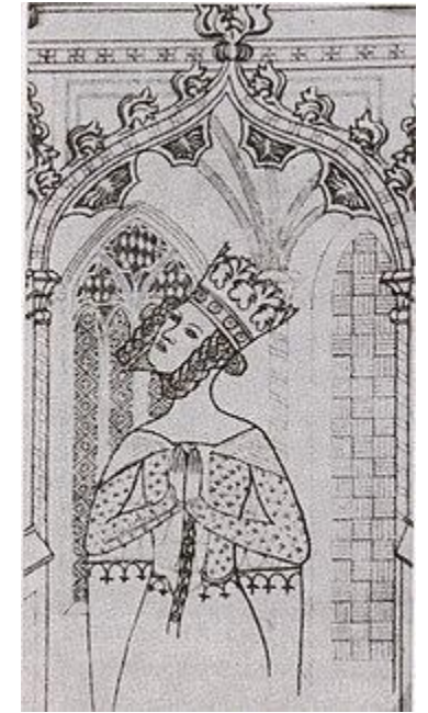
Филиппа де Авен 1314 - 1369