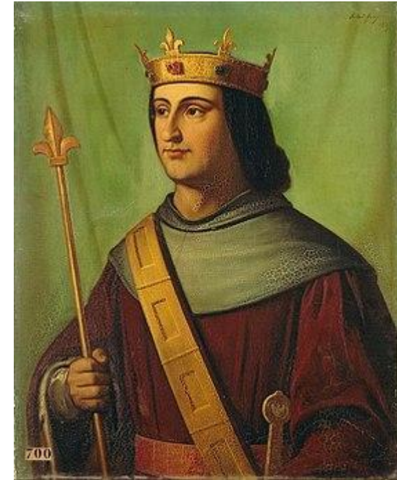
Филипп VI Де Валуа 1293 - 1350