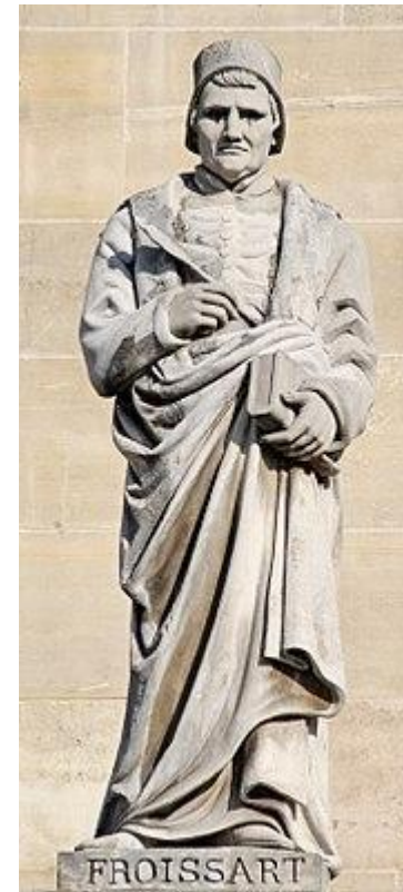
Жан Фруассар 1337-1410