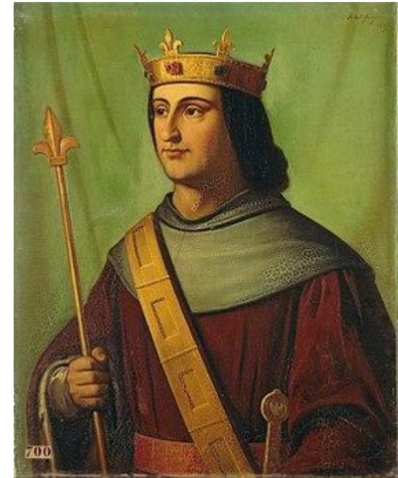
Филипп VI Де Валуа 1293 - 1350