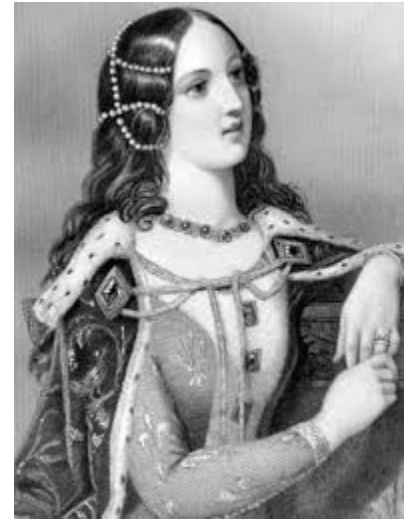
Изабелла Французская 1295-1358