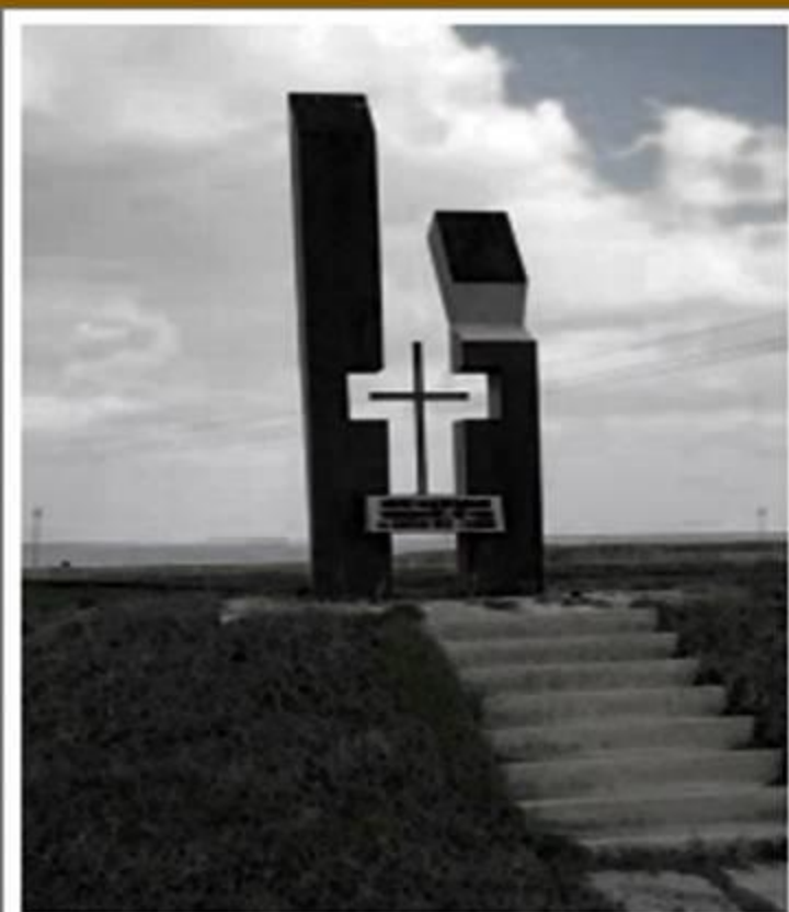
А.Л.Ж.И.Р. - Акмолинский лагерь жен изменников Родины