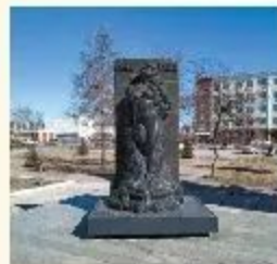
Скульптура в память о погибших в катастрофе (Уфа)