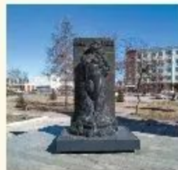
Мемориал «Судья и солдат» в г. Симферополь