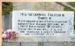
Мемориал «Судья и солдат» в г. Симферополь