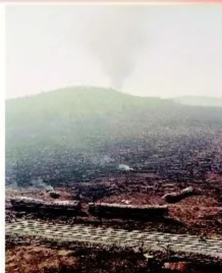
Местонахождение склепа в долине вулкана Мезма.