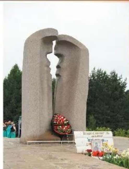
Мемориал «Судья и солдат» в г. Симферополь (1998) в центре г. Троицк (ныне г. Симферополь)