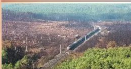
Вулкан в долине реки Улу-Теляк