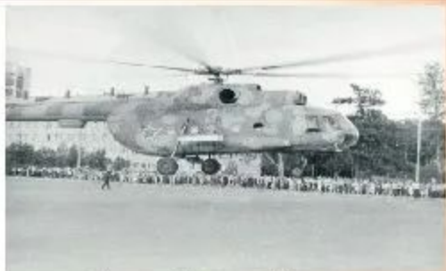
Пожарный вертолёт Ми-2 в аэропорту в Чеченском аэропорту