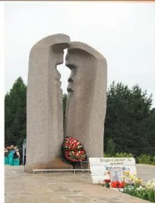
Мемориал в память о погибших в катастрофе МС-802 в долине вулкана Мезма (1988) в склепе в долине вулкана Мезма.