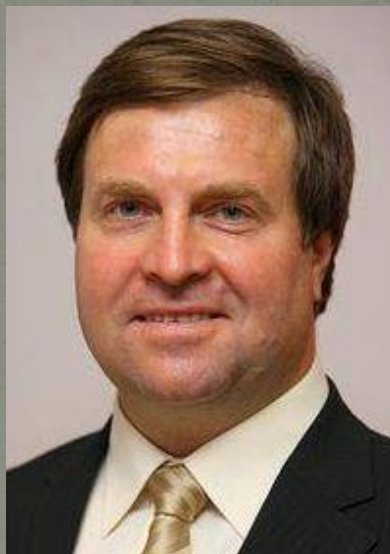
Сальников Владимир Валерьевич (Плавание)