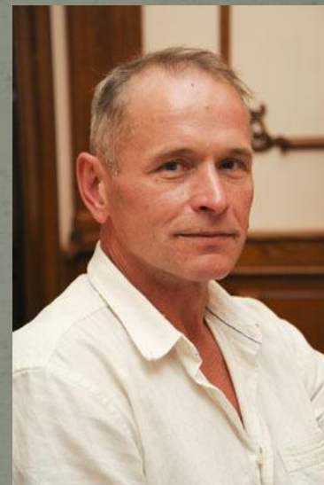
Дитятин Александр Николаевич (Спортивная гимнастика)