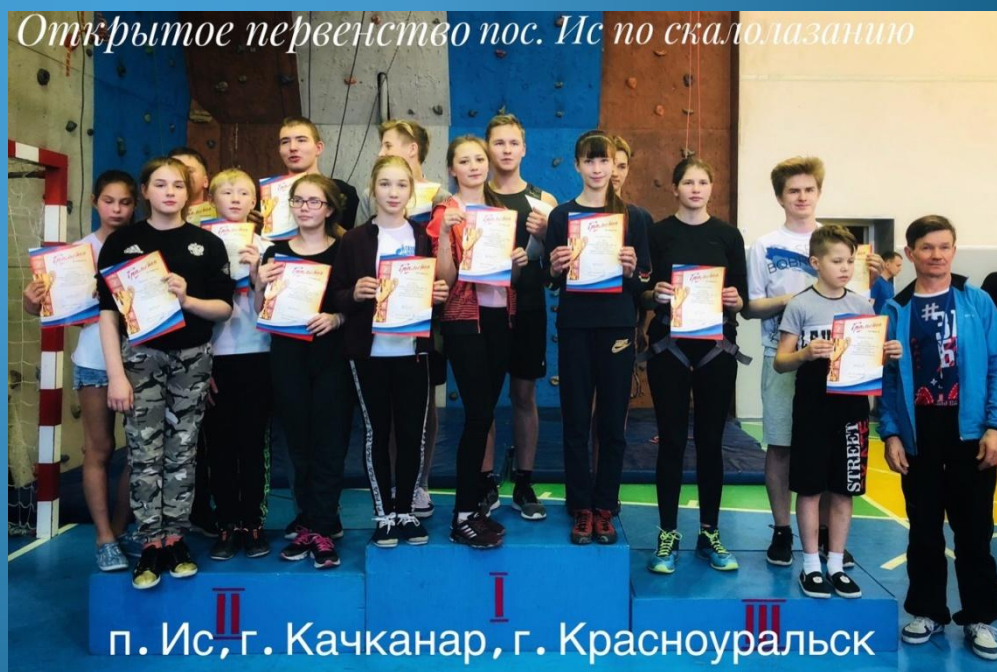
Открытое первенство пос. Ис по скалолазанию