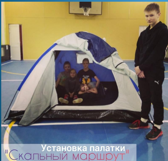
Установка палатки "Скальный маршрут"