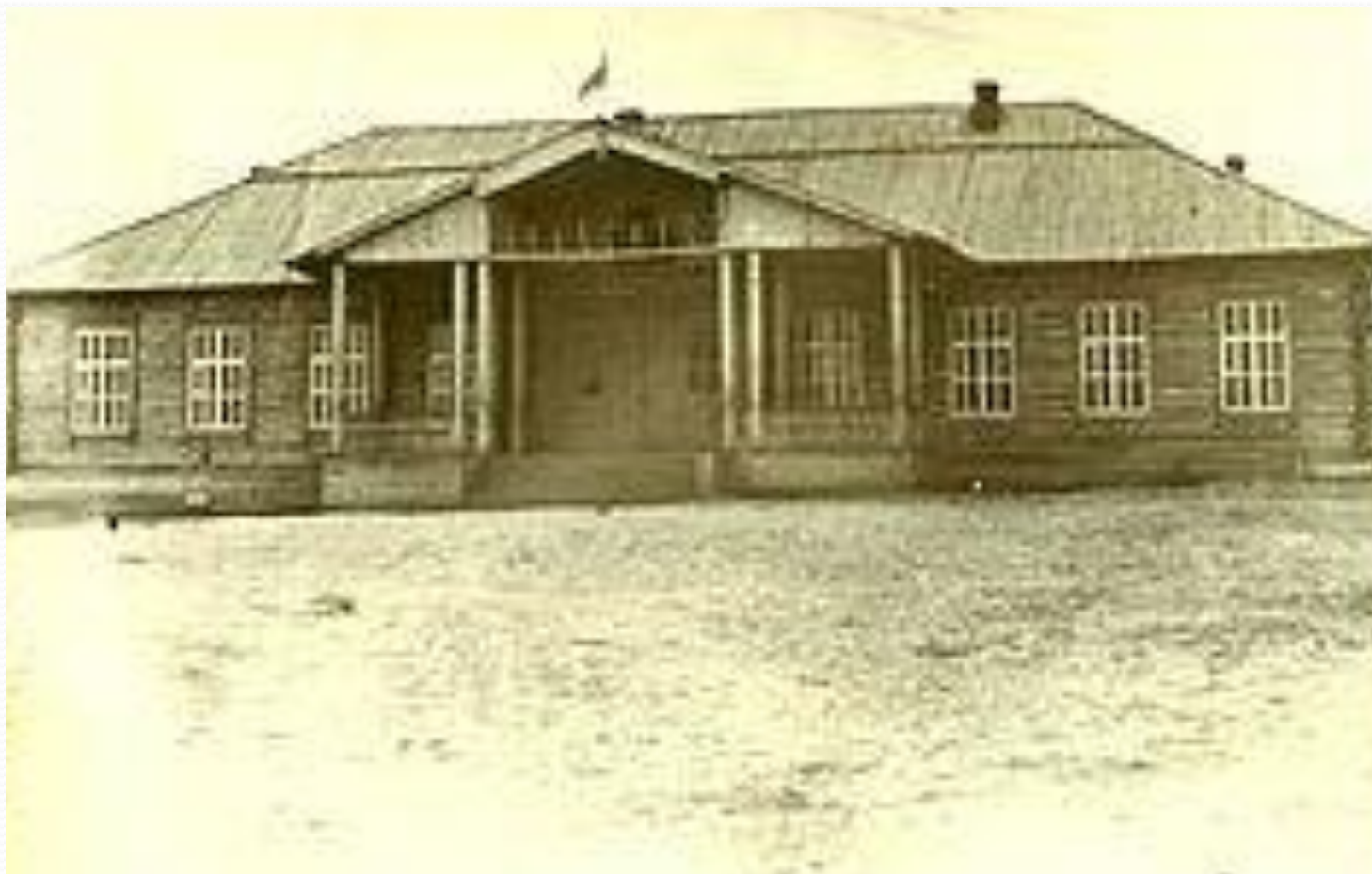
Начальная школа. 60-е годы