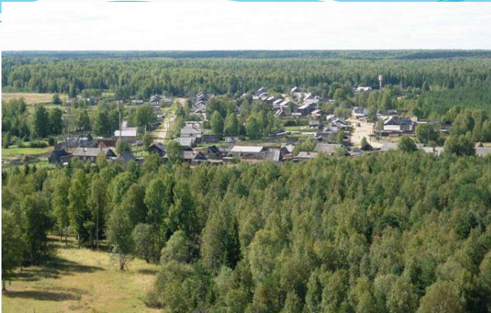
Подрезчиха с птичьего полета