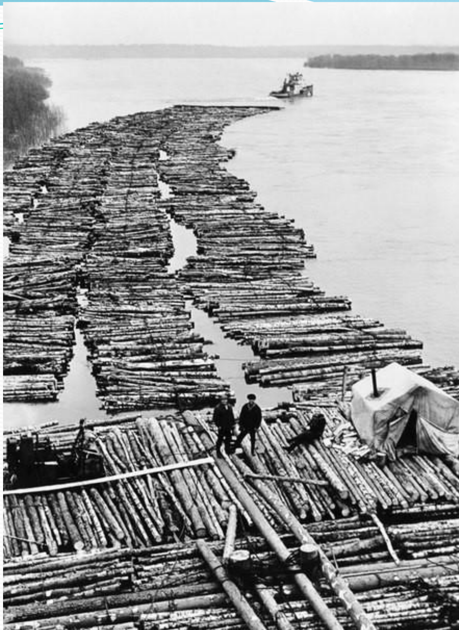
Слав. Первый плот.