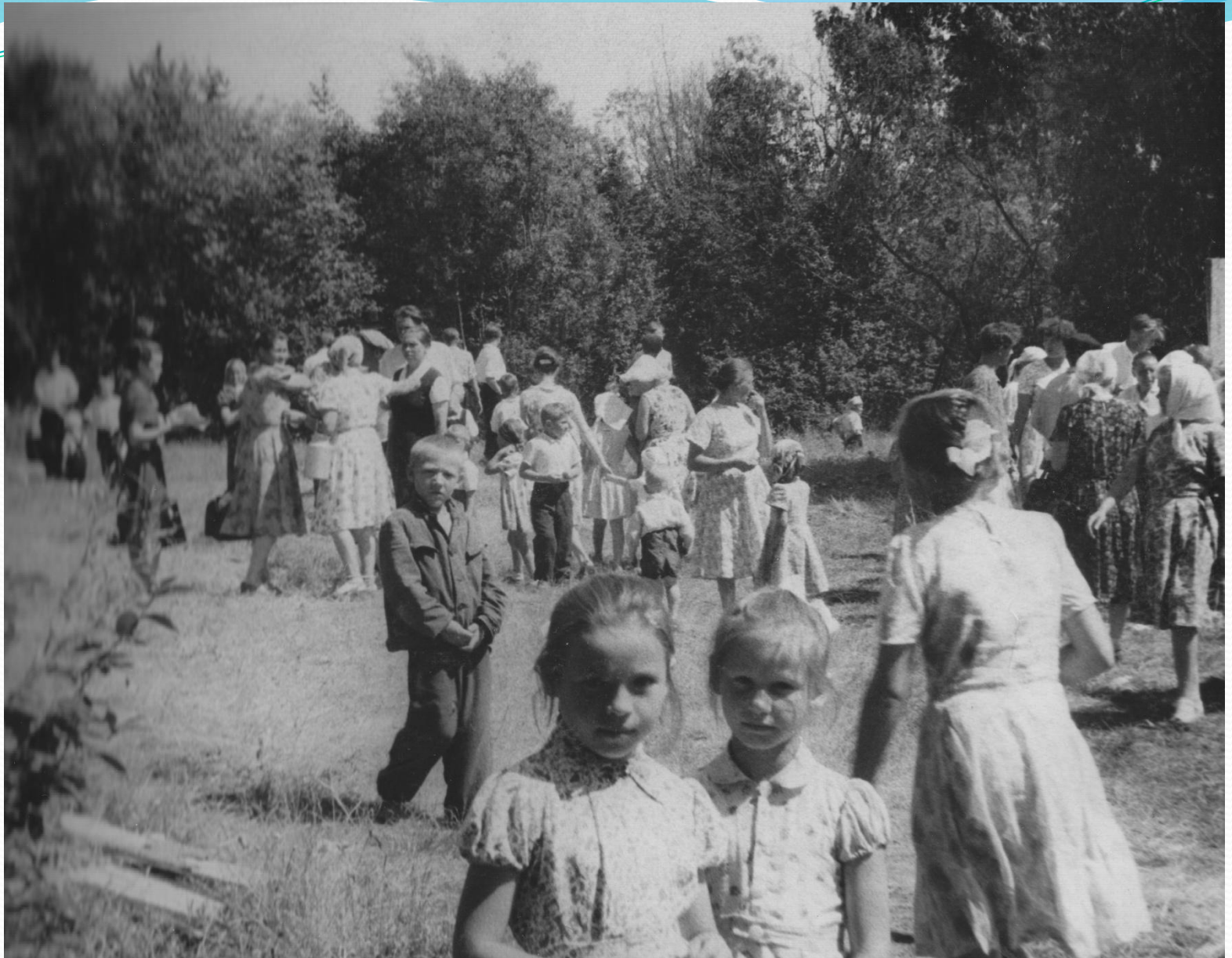
Массовые гуляния за Вяткой в день Молодежи