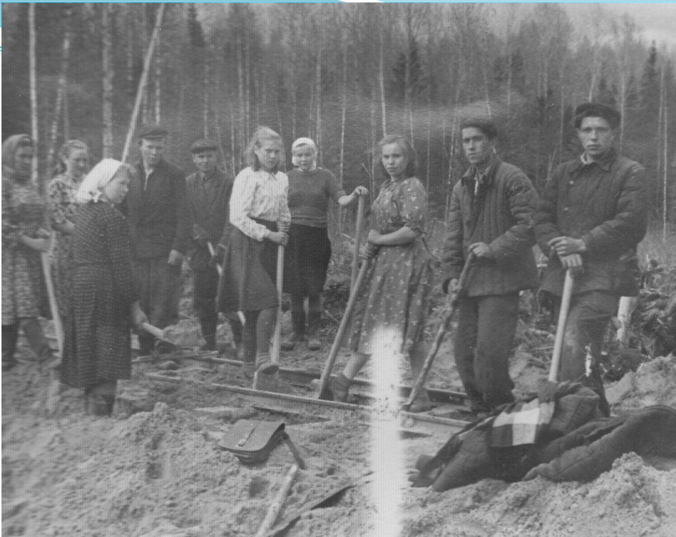
Строительство железной дороги