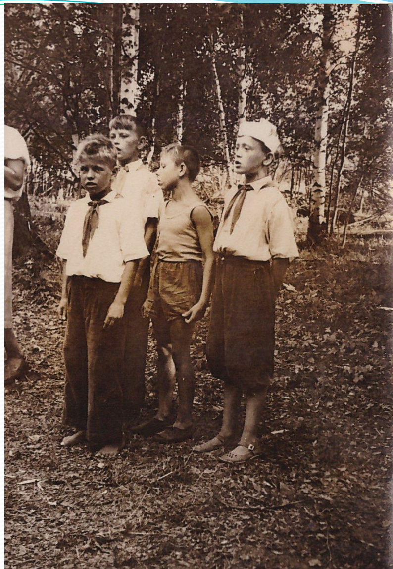
В пионерском лагере