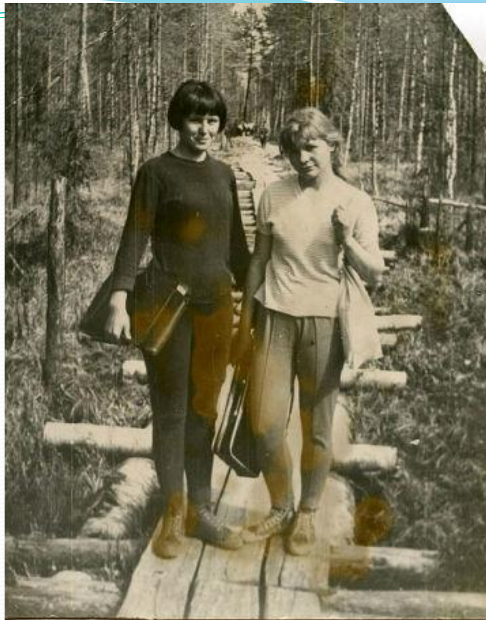
Тропинка в школу