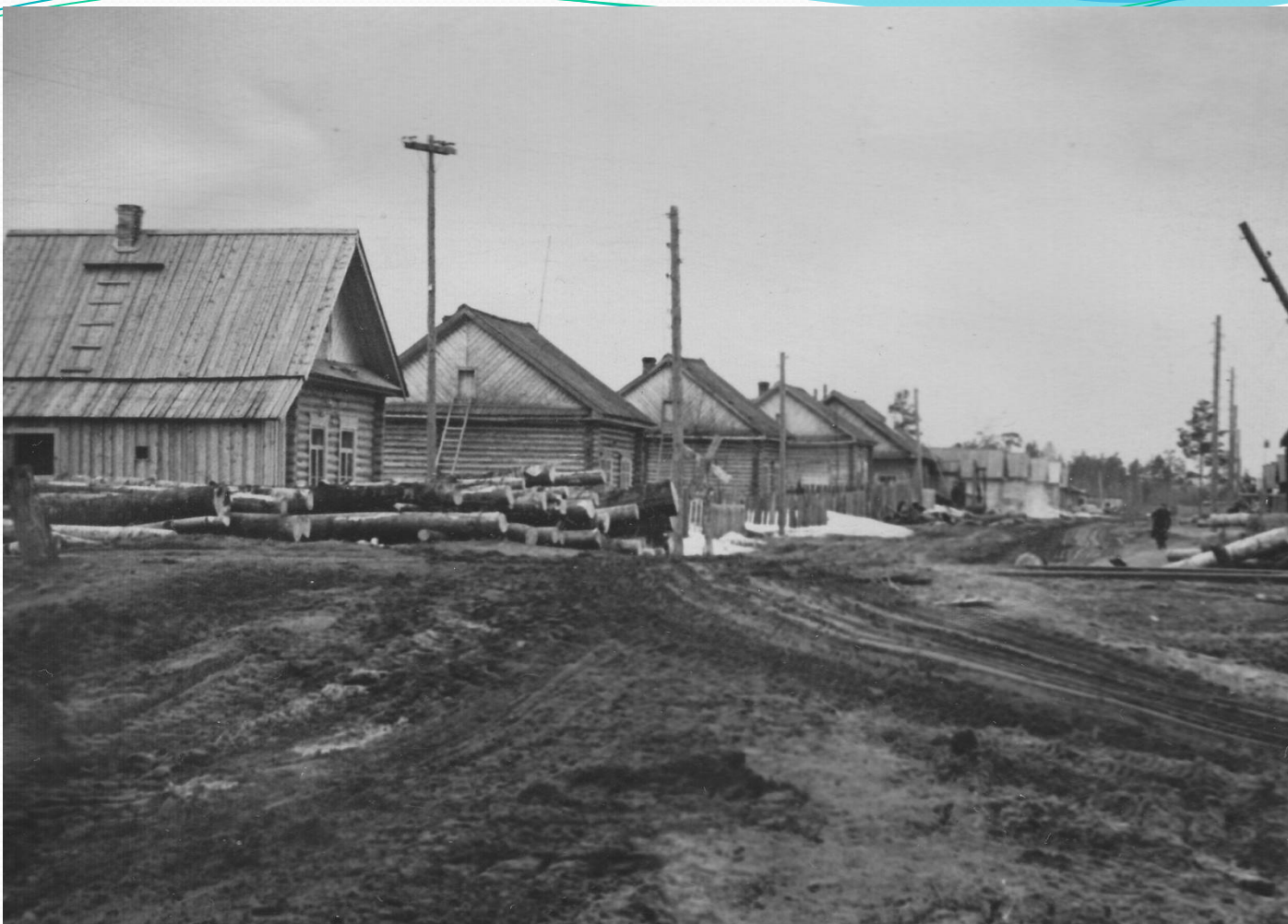
Улица Коммуны. Начало 50-х годов.