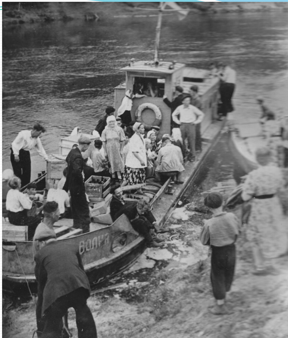
Разгрузка баржи с продуктами