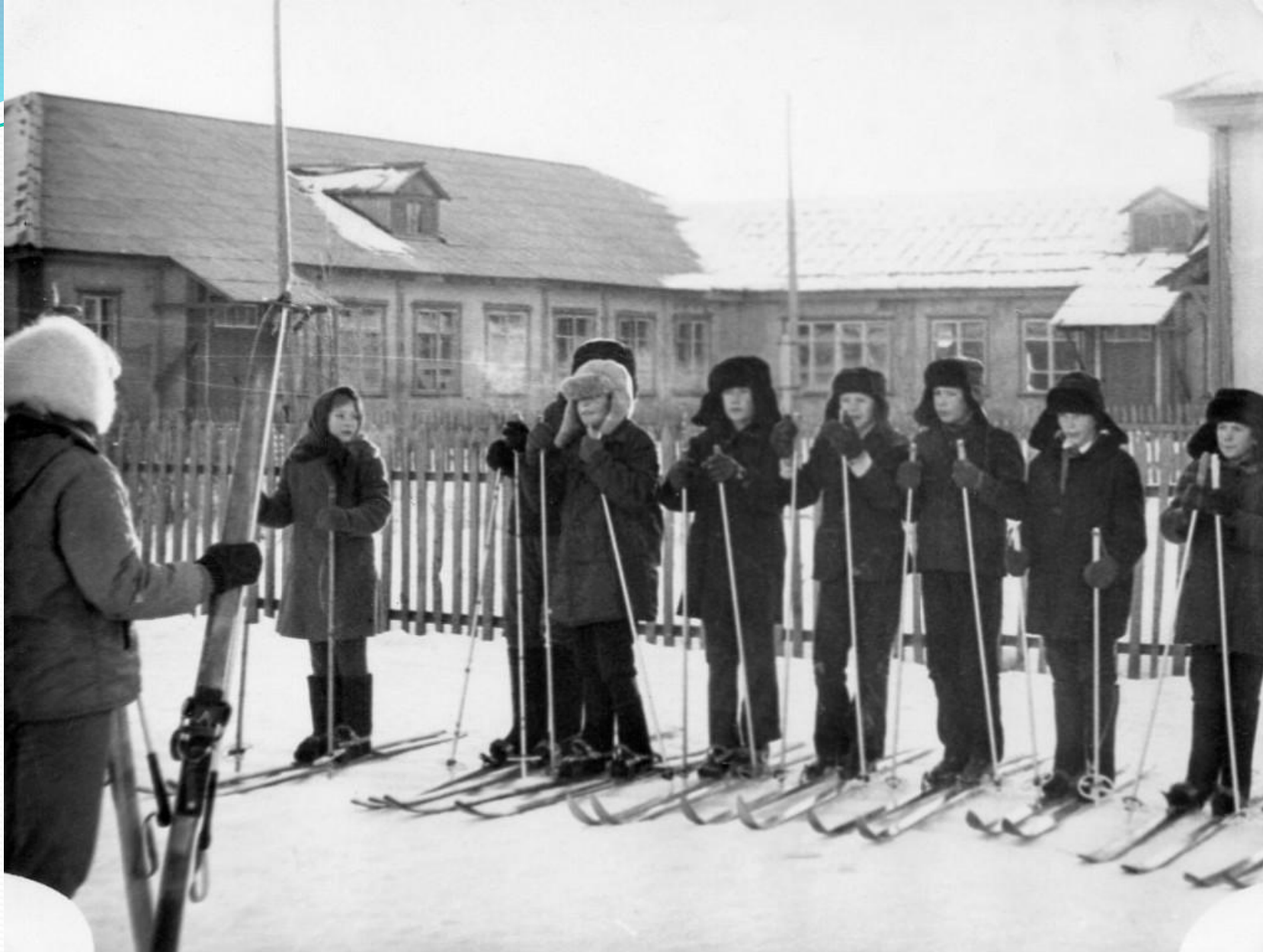
Урок физкультуры. 70-е годы