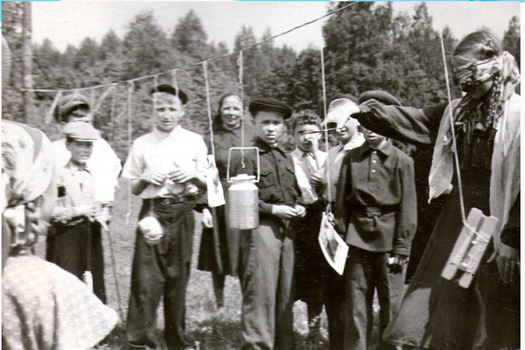
Игры для детей