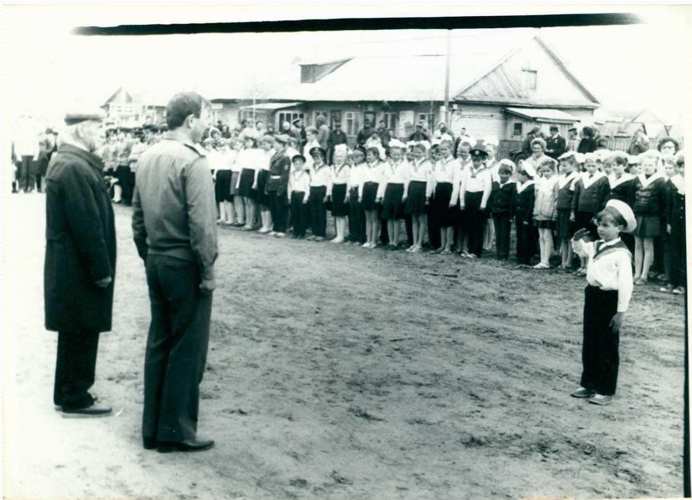
9 мая. Парад